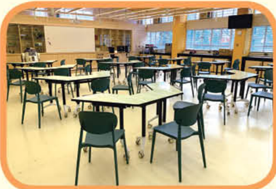
學習設計與繪圖的教學區