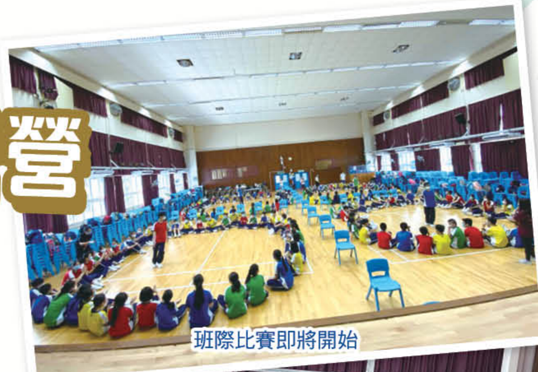
班際比賽即將開始