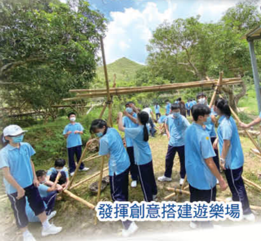
發揮創意搭建遊樂場