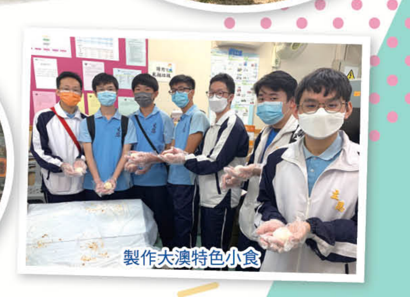
製作大澳特色小食