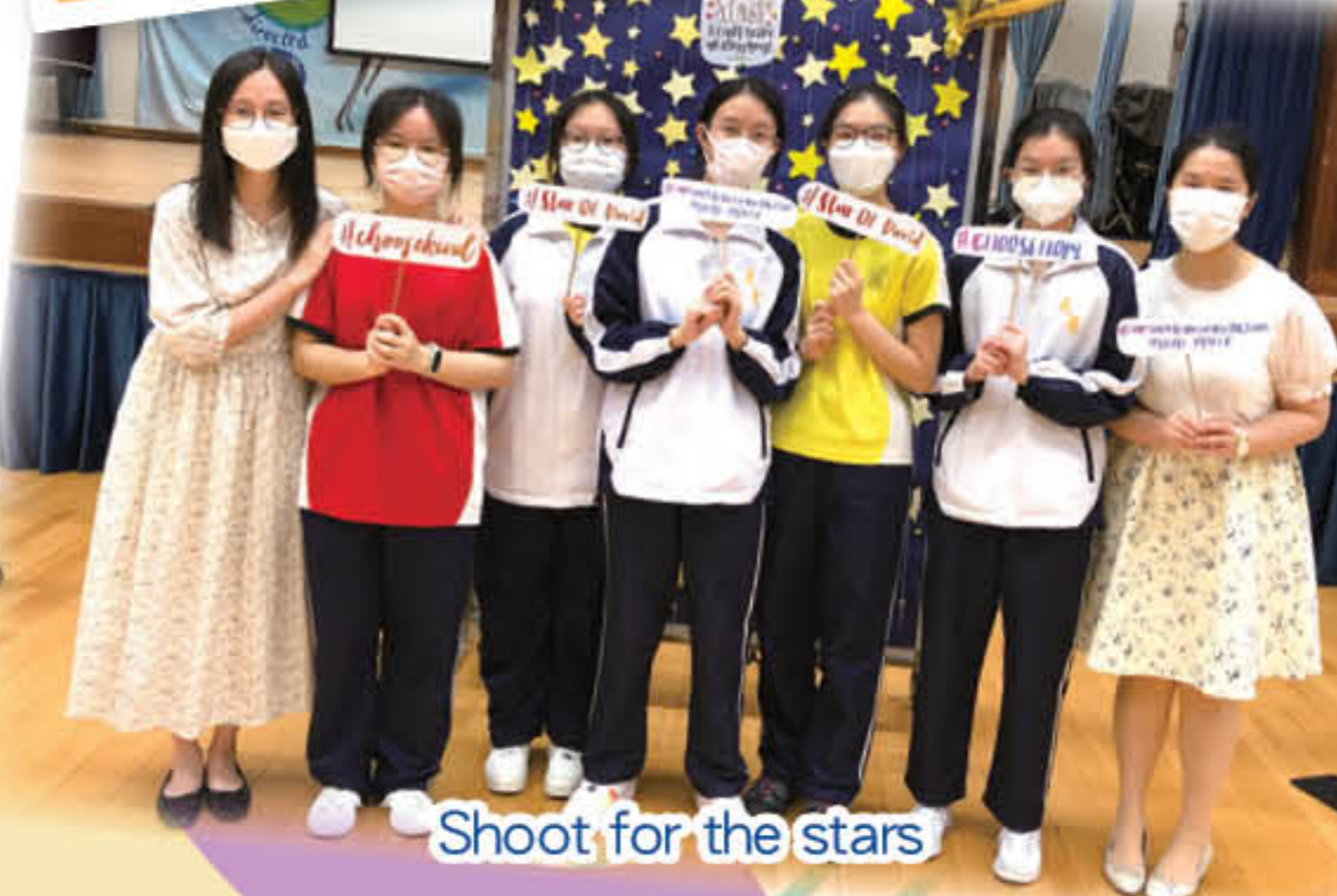
Shoot for the stars