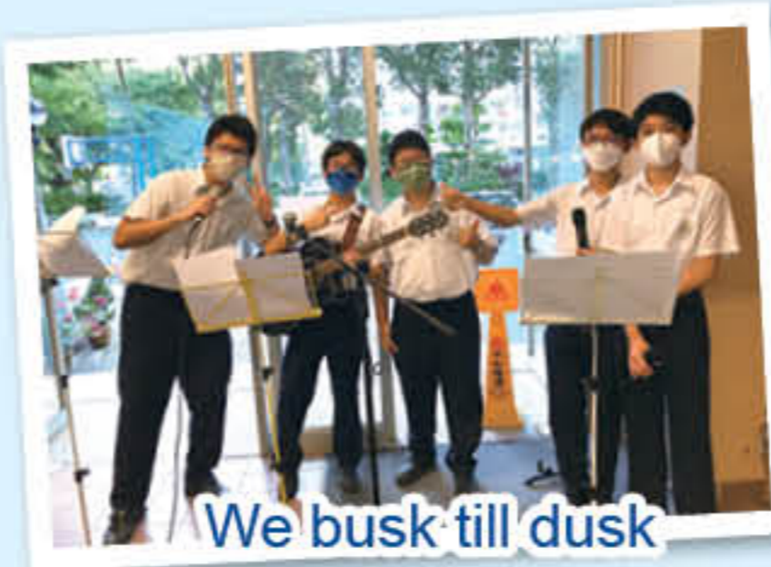
We busk till dusk

As the saying goes, 'Life is a box of chocolates; you never know what you're going to get.' To CDG students, however, school life on English Speaking Wednesdays is, with certainty, a big feast. The dining restrictions in the city, be it two or four people per table, are never applied on campus.