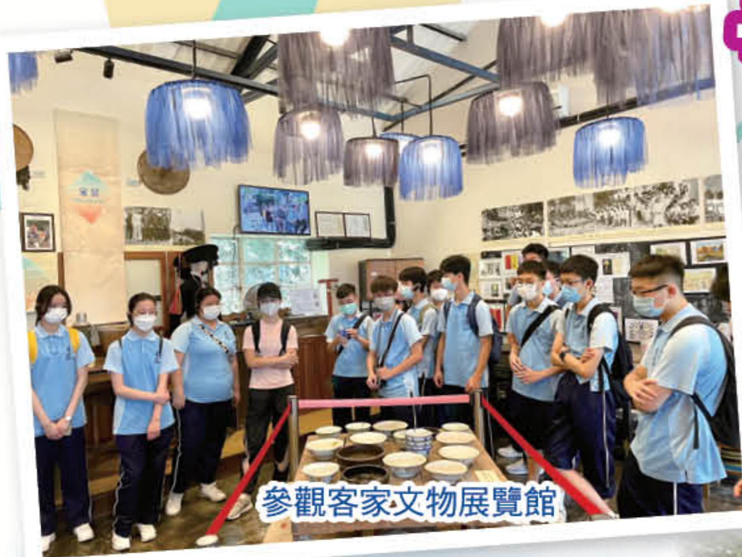
參觀客家文物展覽館