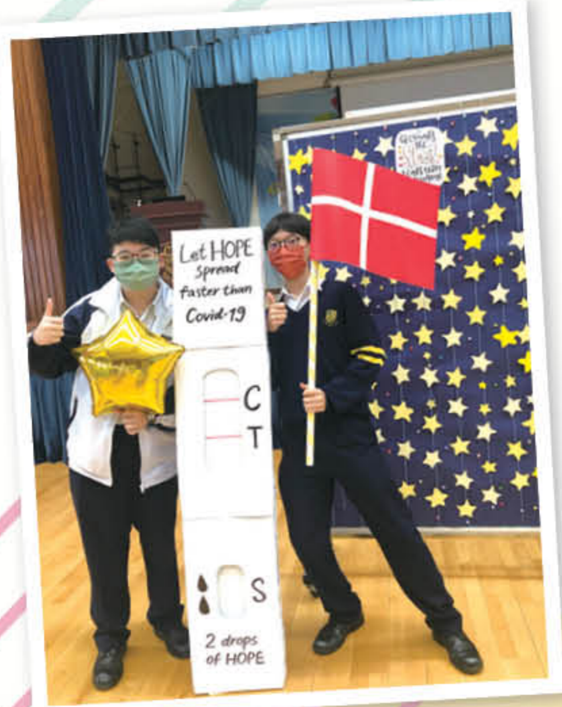
Let HOPE spread faster than Covid-19