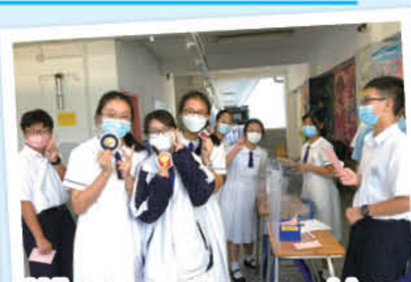
Which emoticon would you pick to represent CDG?