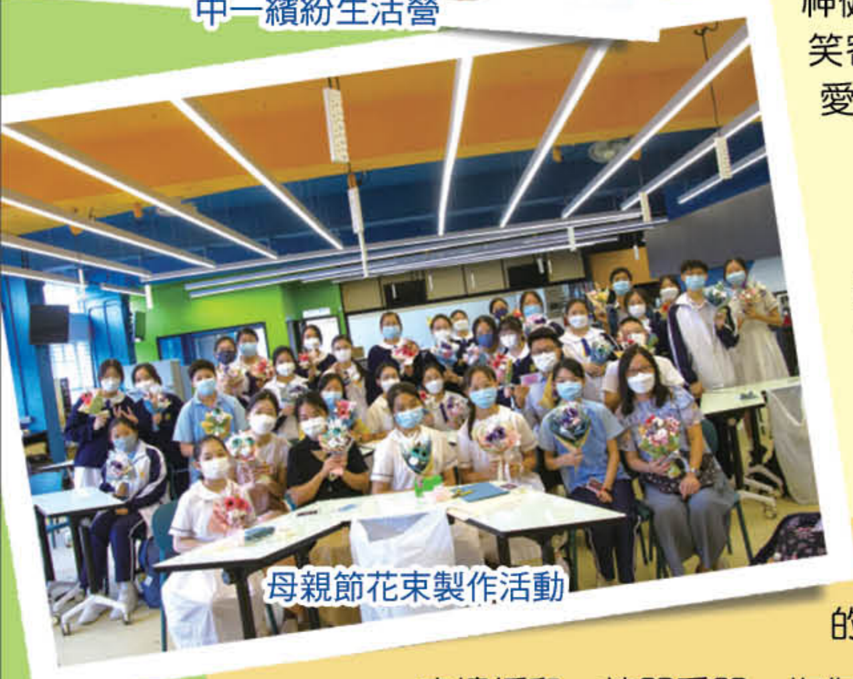
母親節花束製作活動