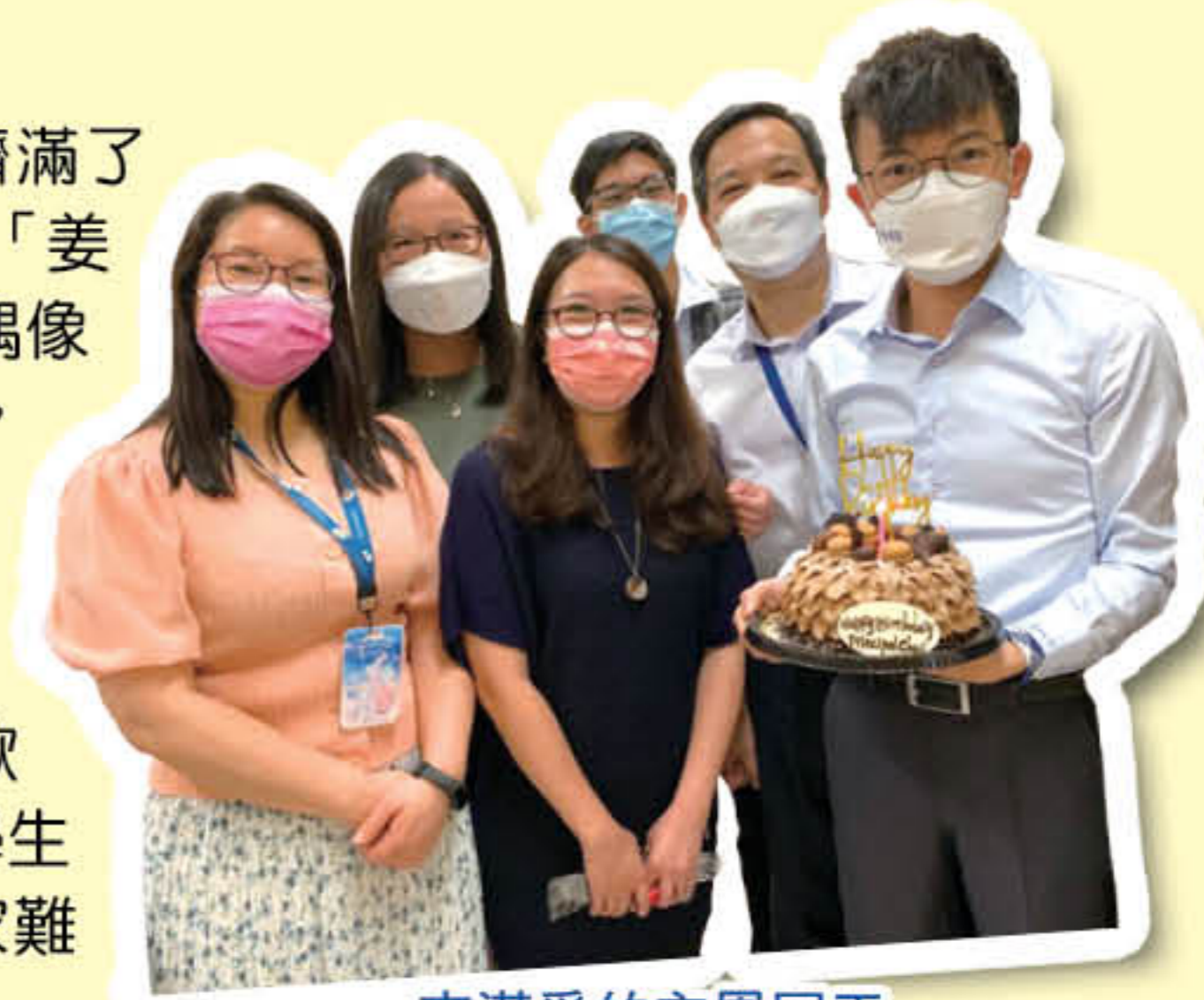
充滿愛的主恩同工

以前我們談到顏值，總會比較美醜高矮肥瘦，但現在談的，則是口罩差別。我猜大家也有所體會吧！疫情期間認識的朋友，當脫下口罩，總是對不上預期的模樣，好像那根本不是我認識的人。又或戴口罩時間久了，連朋友長甚麼樣子也開始模糊了。