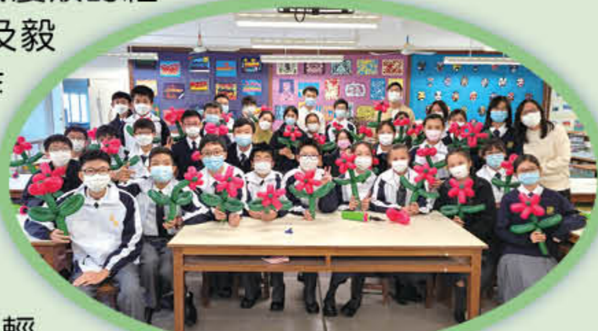
同學們拼砌的花海

在課堂內，導師透過自學扭氣球的經驗，分享屢試屢敗的經歷，幫助同學明白熱情及毅力的重要。同學透過製作花朵和狗造型氣球學習堅持、有恆心地完成訂下的目標。在活動中，大哥哥也成為小弟弟的同行者，一同接受挑戰，不輕言放棄。