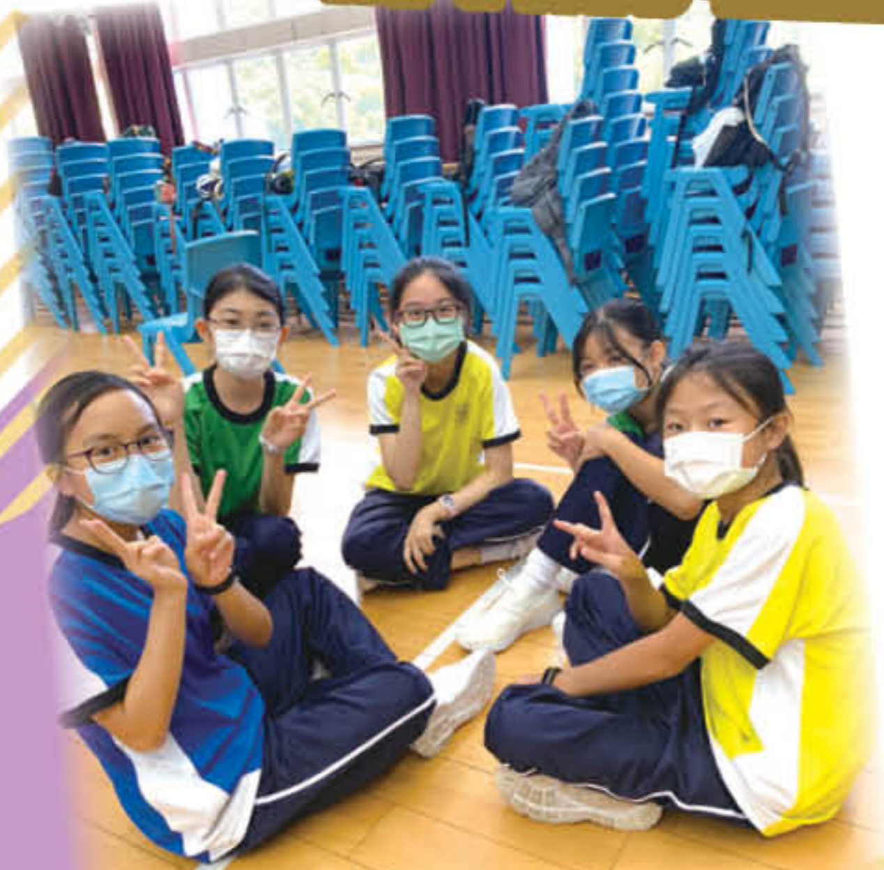
大姐姐率領小师妹進行分組活動