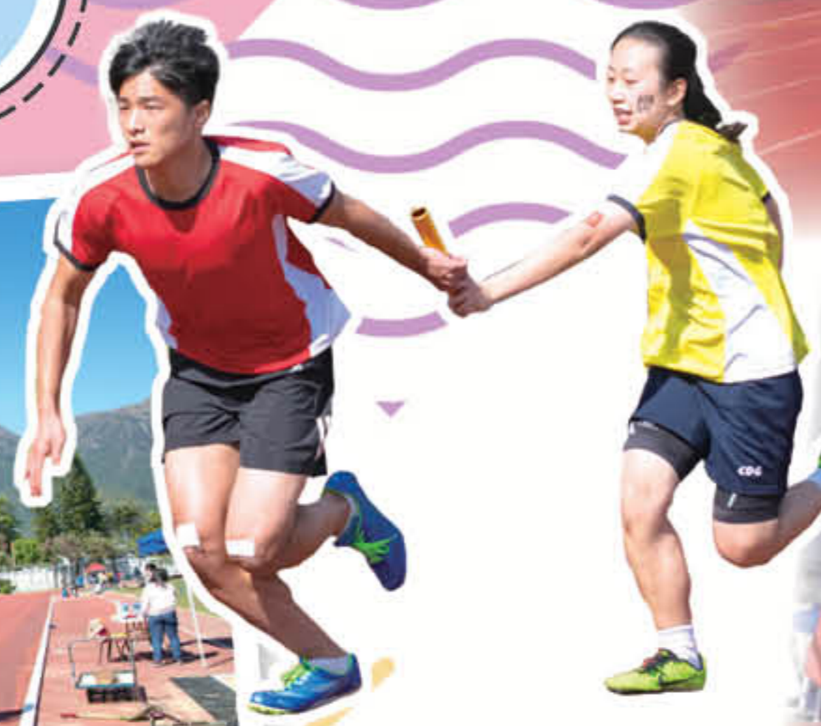
緊張刺激的接力賽