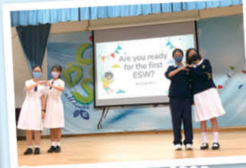
Our masks cannot hide our excitement and commitment!

Our English Ambassador Team, despite the doom and gloom of the pandemic, has managed to organise a feast every Wednesday against all odds under the theme of 'Savouring' this year. The appetiser is served by the team, who welcomes everyone briskly in the early morning. The choices of main courses usually consist of face-to-face speaking booths during recesses or online book sharing activities in the afternoon – all prepared by heart. The desserts for sure win the hearts of many with the painstakingly filmed and sophisticatedly edited videos which capture each lovely moment of the English activities. All teachers and students have their tummies full and minds satisfied at the end of the day.