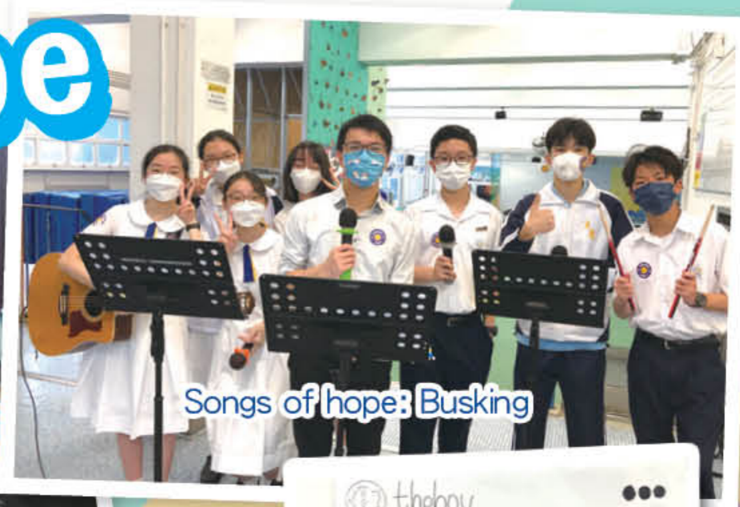
Songs of hope: Busking