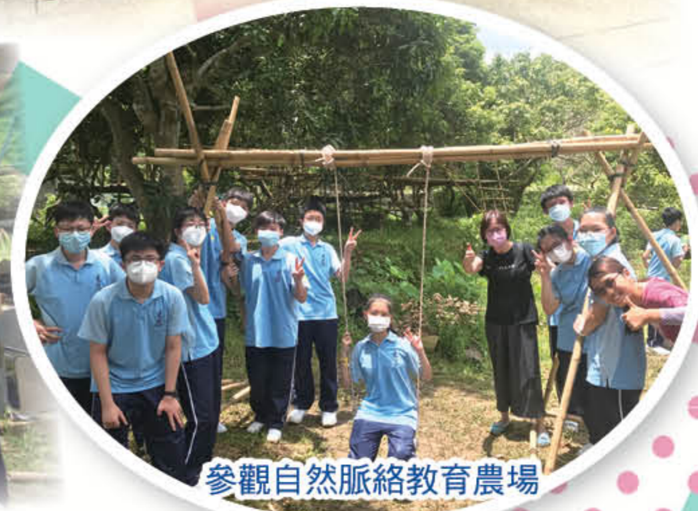
參觀自然脈絡教育農場