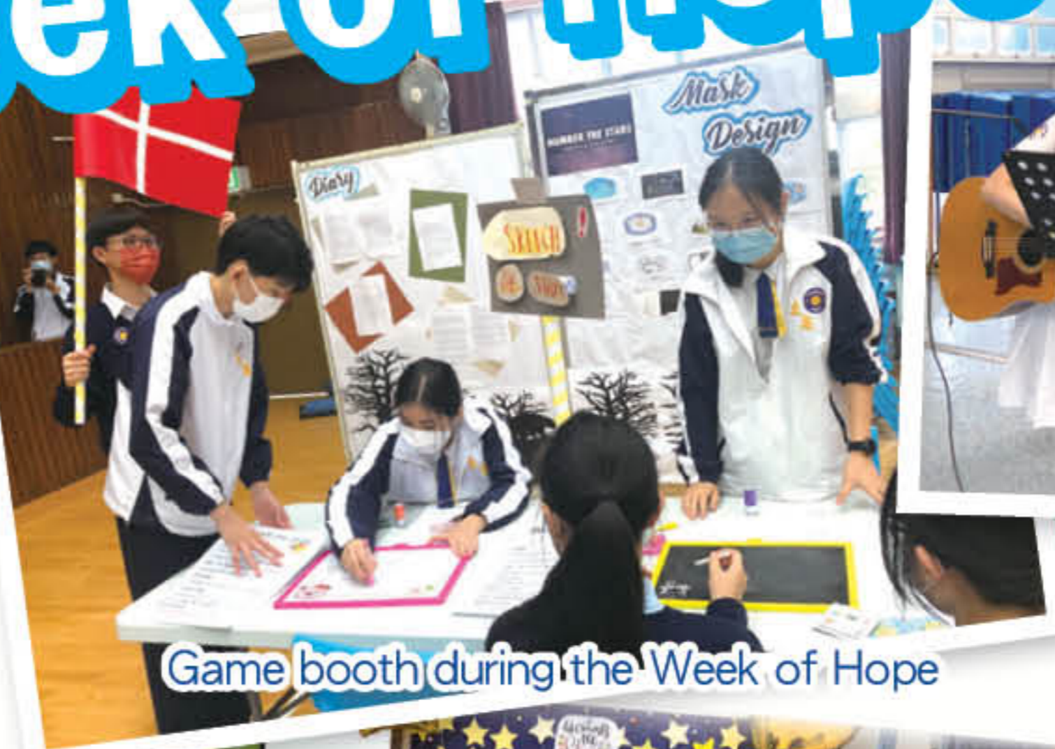
Game booth during the Week of Hope