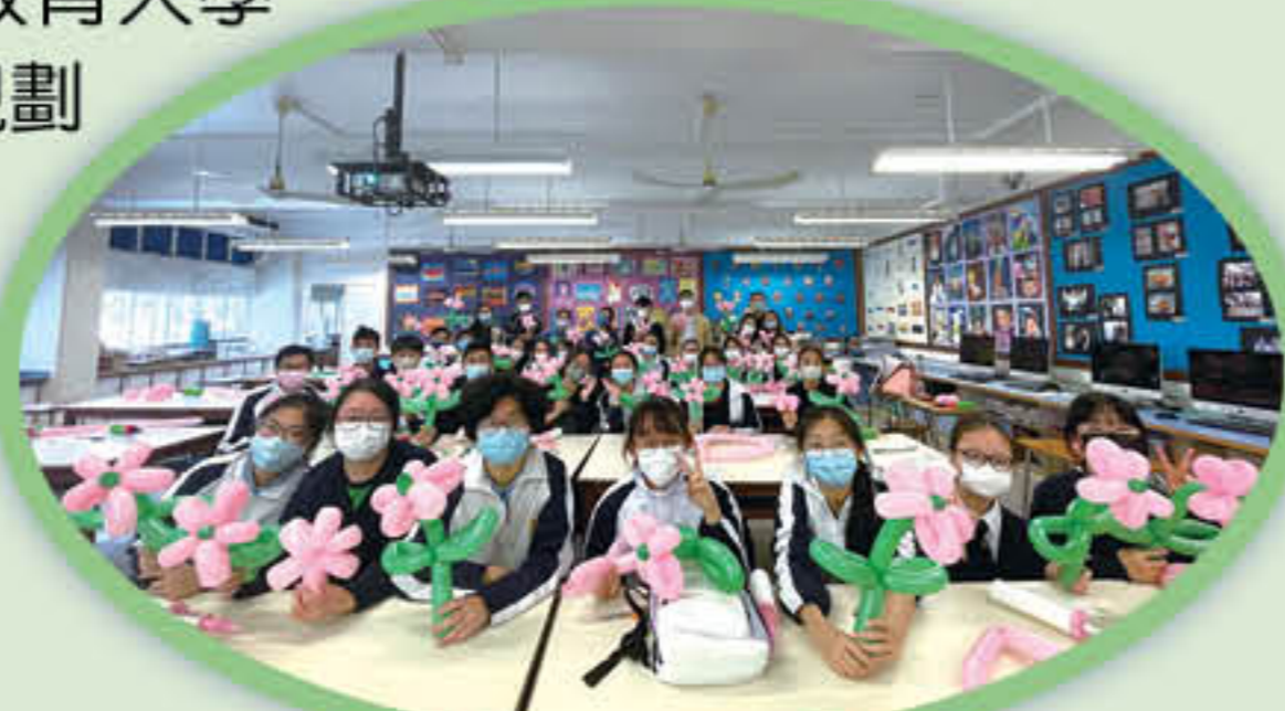
大哥哥學習扭氣球

本校參與了由香港教育大學所舉辦的「協助中小學規劃生命教育課」，本學年在「中一健康教育課」中加入了「扭出堅毅」課程，盼透過扭氣球培養同學堅毅的精神。