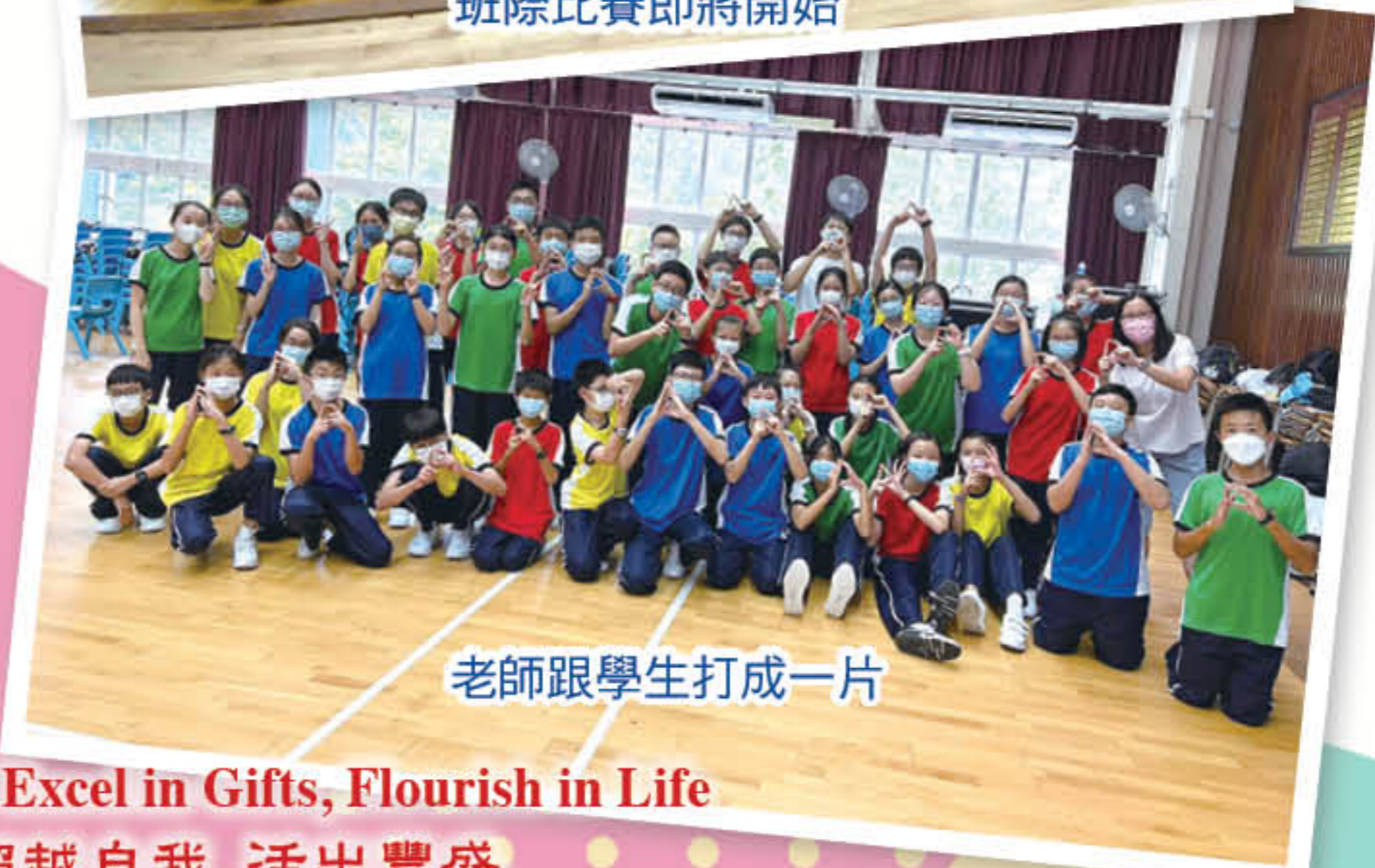
老師跟學生打成一片

Theme of this School Year: Excel in Gifts, Flourish in Life