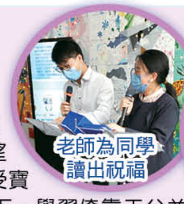
老師為同學讀出祝福

今年的主題為「生命因祂躍動」，我們希望透過福音周鼓勵同學接受寶貴的救恩，在疫情陰霾下，學習倚靠天父並經歷天父所賜的平安和力量，過滿有盼望、滿有力量的生活。