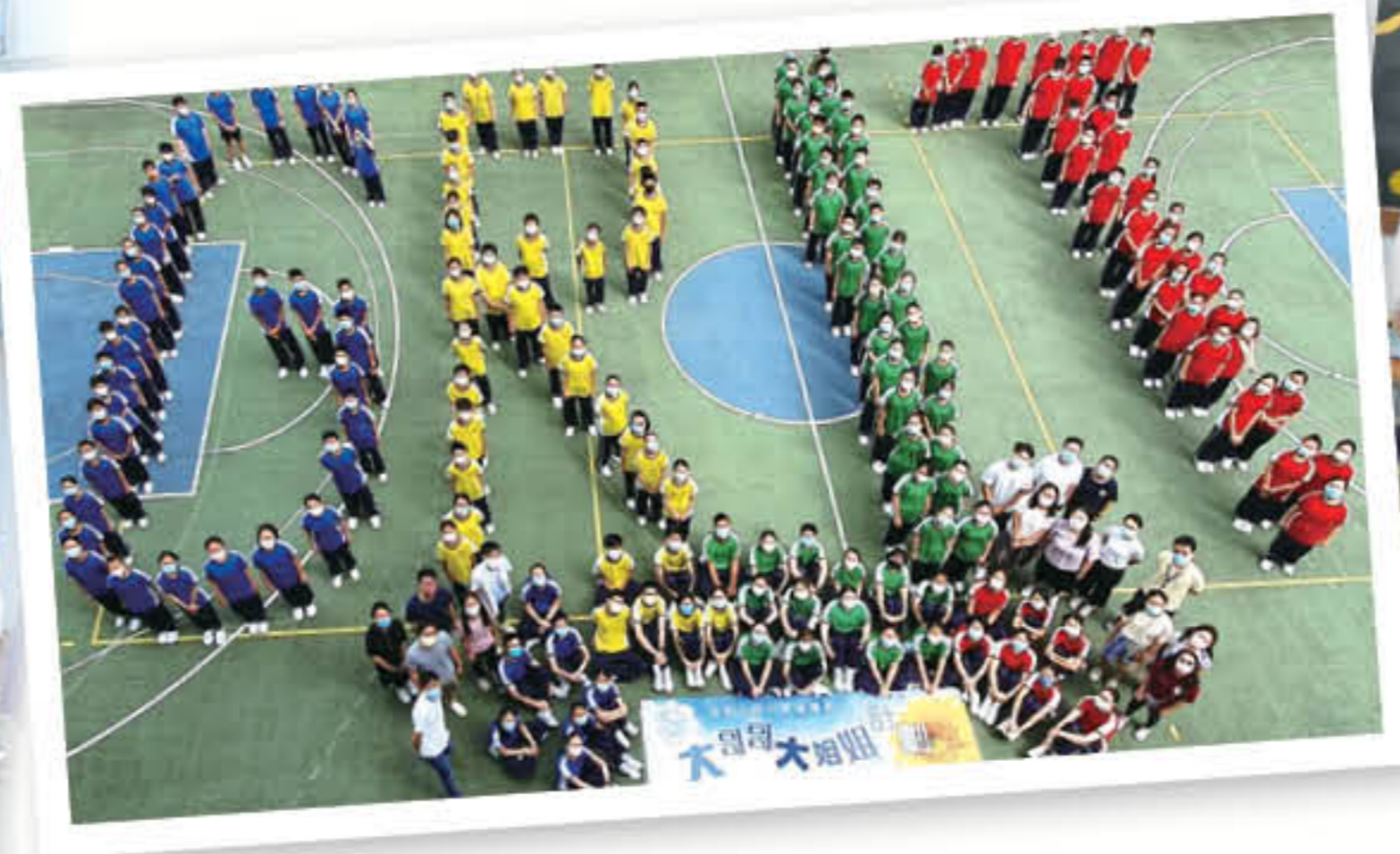
充滿毅力和勇氣的主恩新鮮人