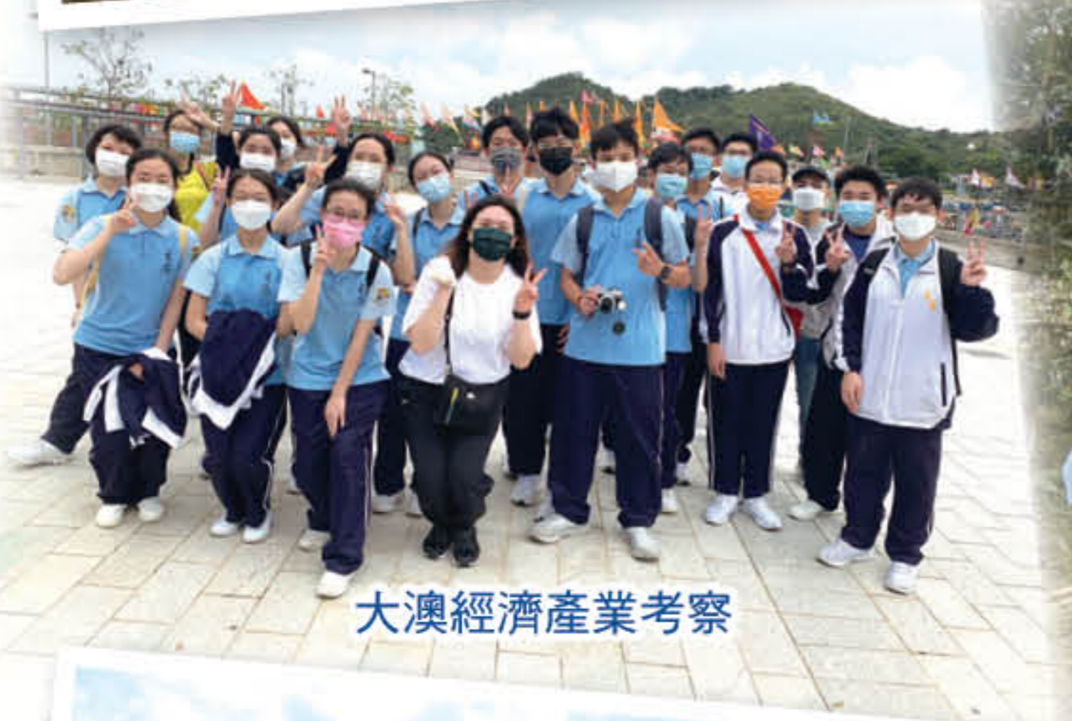
大澳經濟產業考察