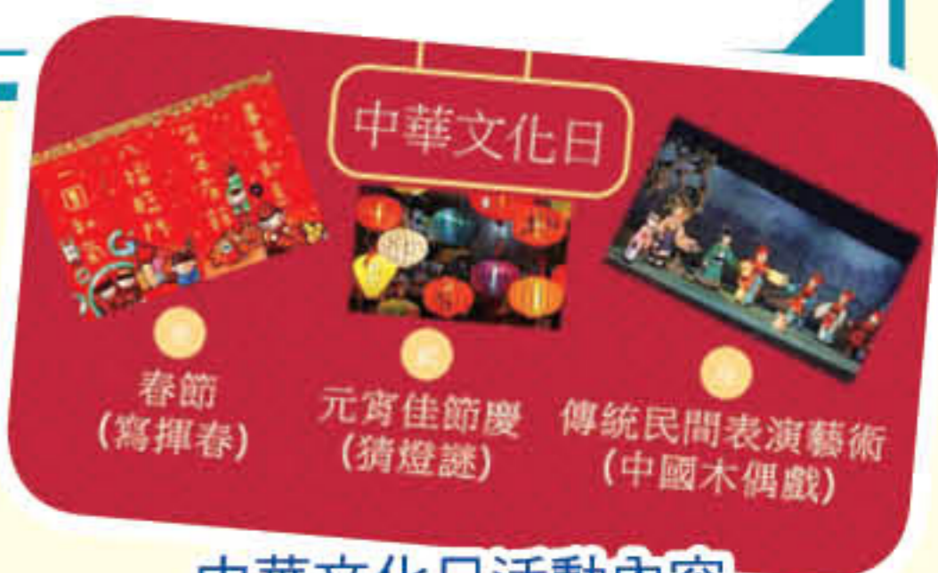
中華文化日活動內容