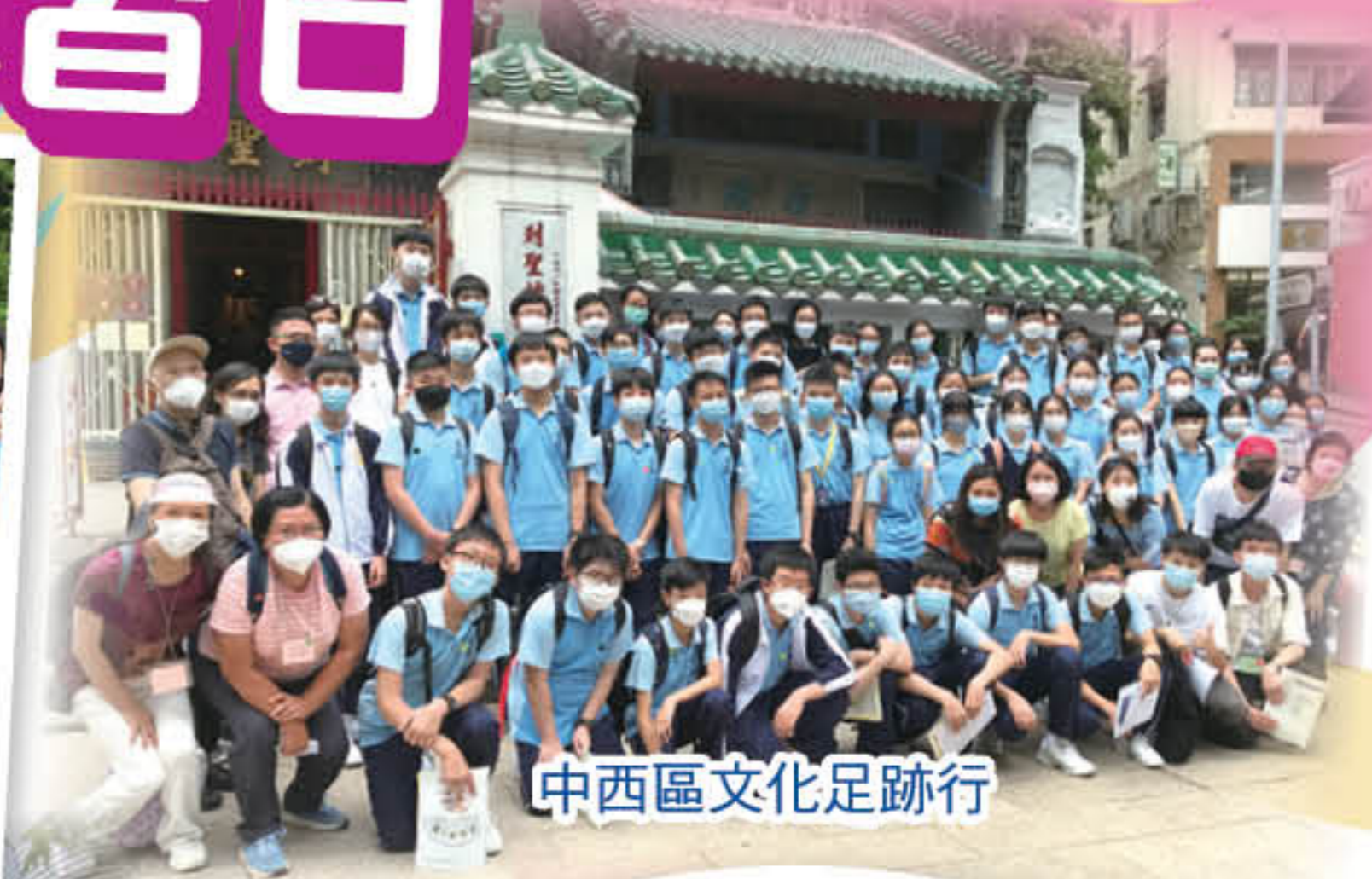
中西區文化足跡行