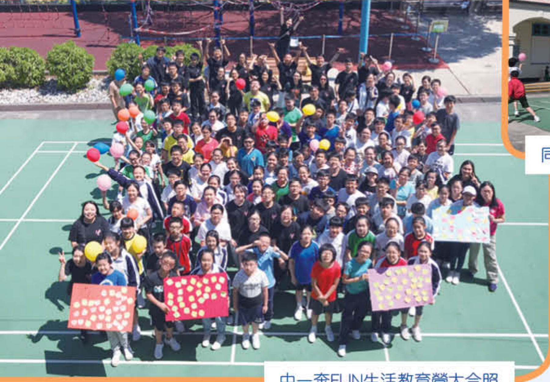
中一奔FUN生活教育營大合照