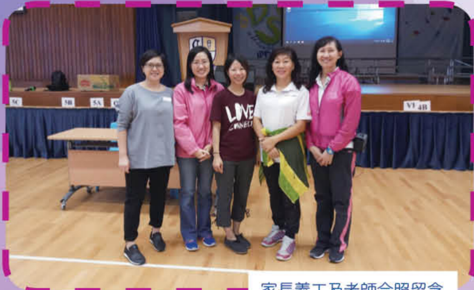
家長義工及老師合照留念