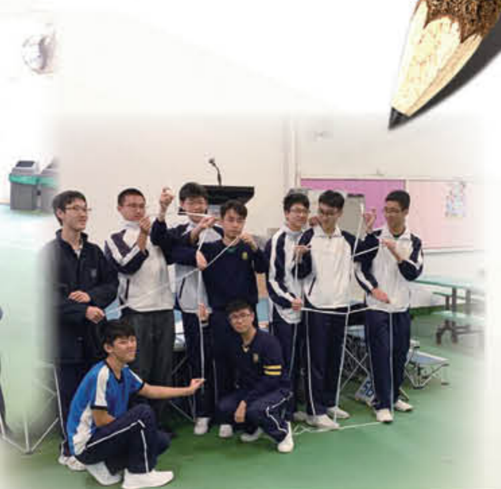
同學合力用繩砌出一個「袖」字

School Motto: Self-discipline through the understanding of the Word, Service to mankind through faithfulness to the Lord