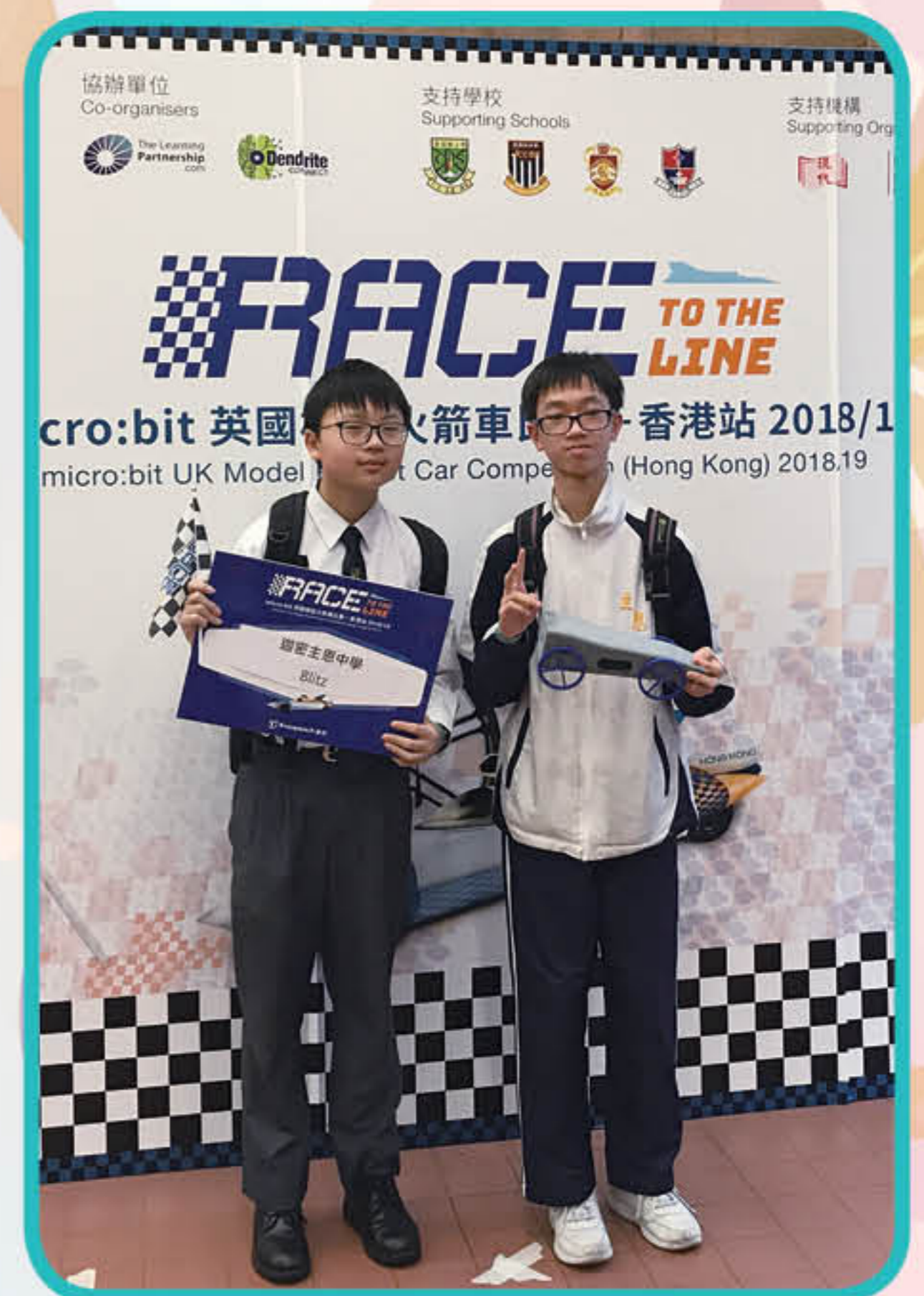
同學於「英國模型火箭車比賽」中獲得二等獎