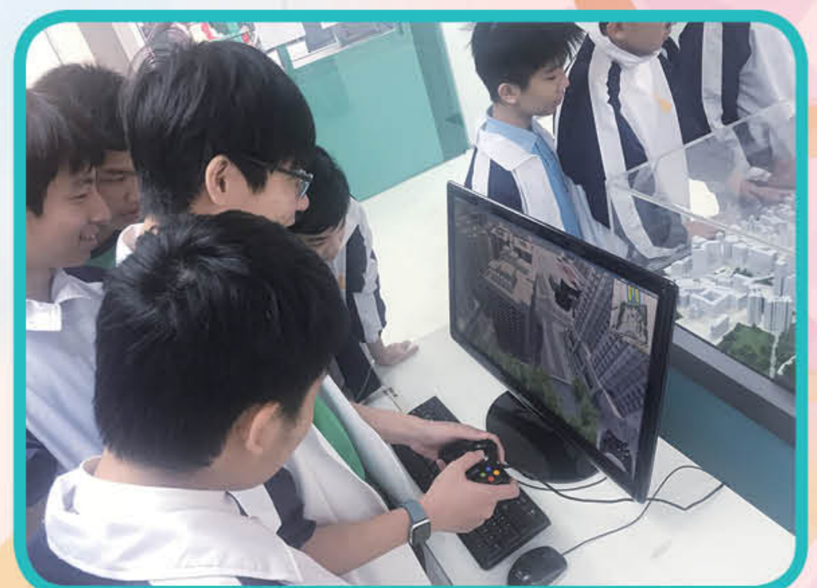
參觀中九龍幹線工程社區聯絡中心