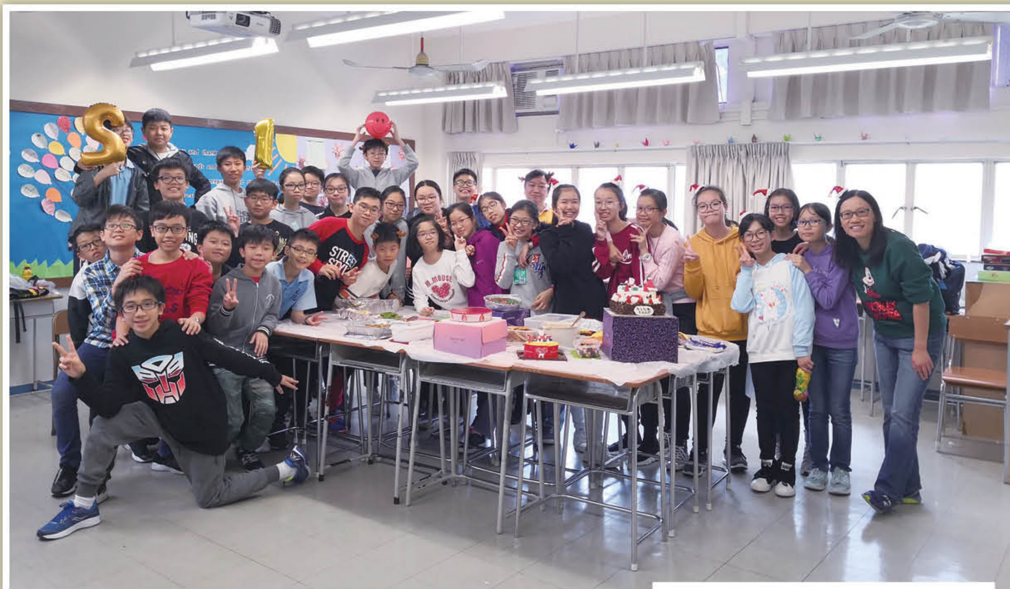
1D班在聖誕聯歡會分享食物，彼此服事