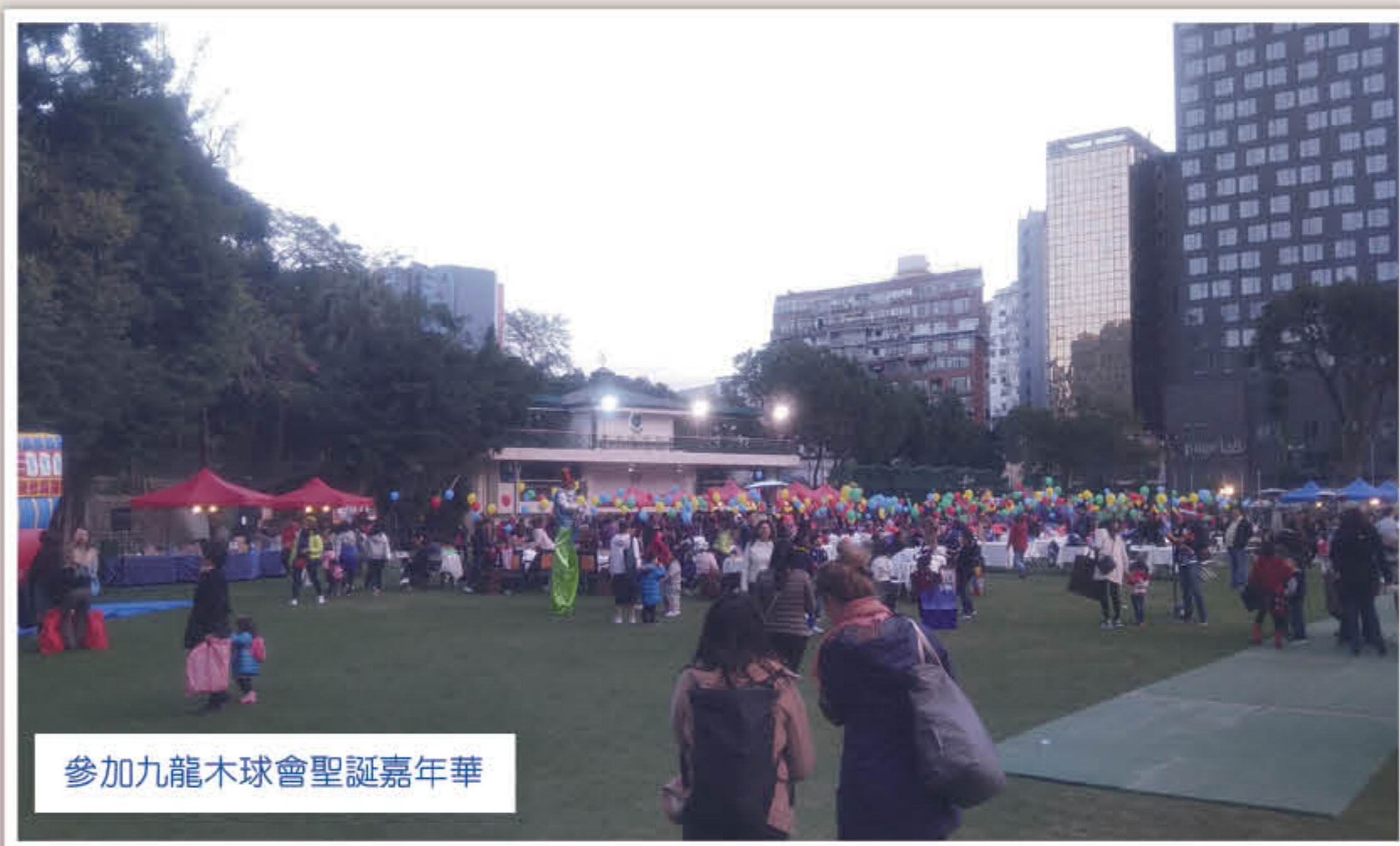
參加九龍木球會聖誕嘉年華

我非常慶幸能參與這活動。與智障人士相處，我想最重要的是要有一顆為他人設想的心，漸漸理解他們的感受，這便能察覺他們可愛的一面。