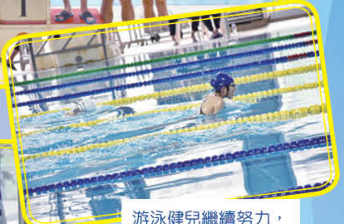
游泳健兒繼續努力，爭取好成績