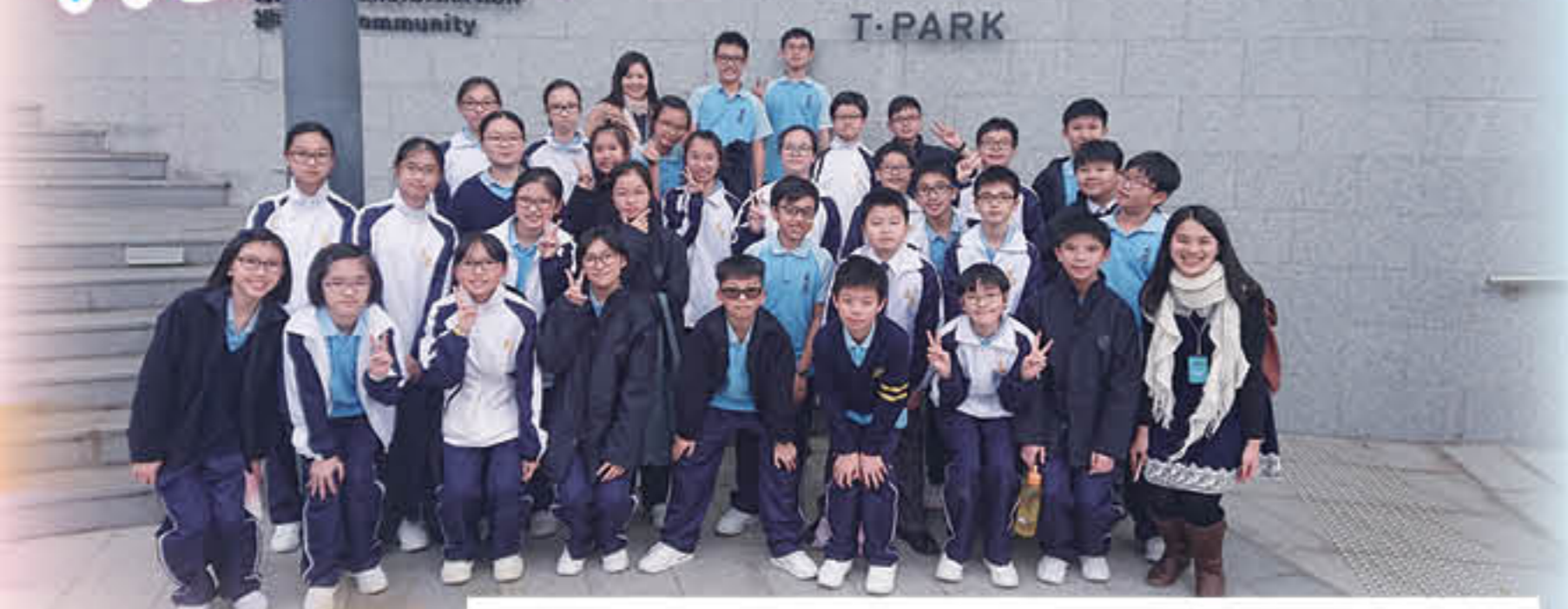
T · Park, where we gathered ideas of upcycling

With months of trial and error, which is fundamental to every problem-solving process, the final upcycled products made are a testimony to how trash can be transformed into treasures. The little transformers have taken away the lesson that while they are humble witnesses to enjoy the privilege of nature, they can also be creative contributors to undertake the duty to paint our environment, with their bare hands, from grey to green.