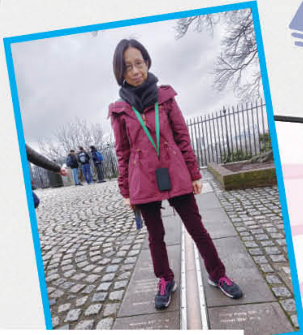
在格林威治皇家天文台的本初子午線上找到了香港