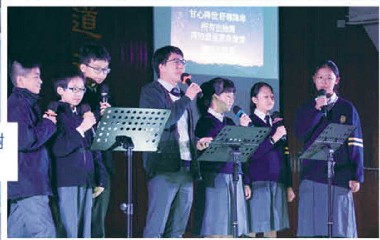
分享詩歌，感謝上帝的恩典