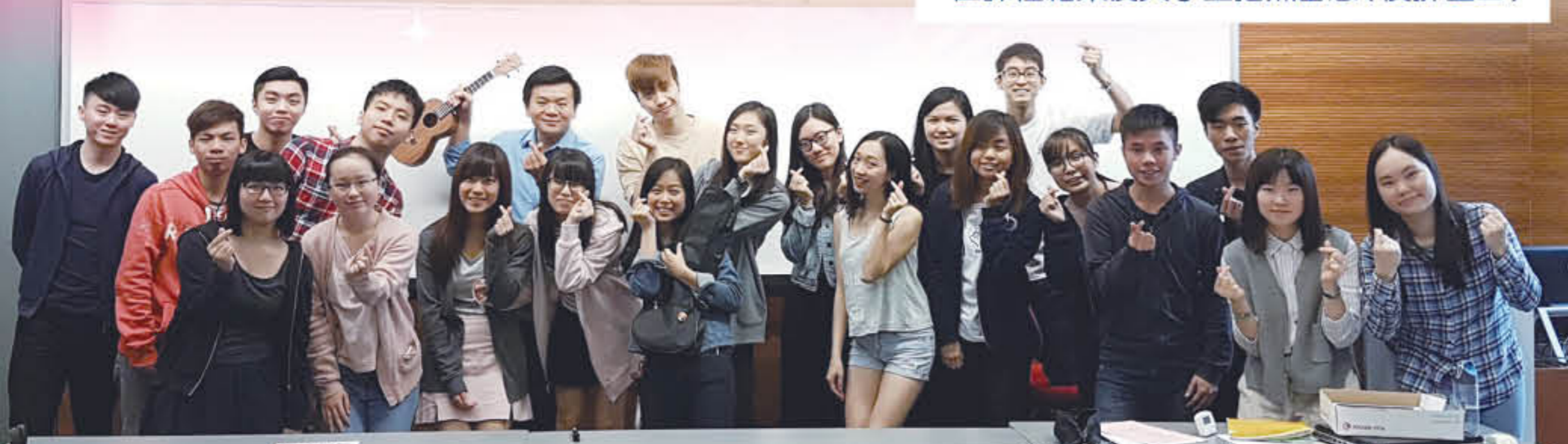
在課程結束後與學生拍照留念(後排左四)

「年輕人有夢，有夢才年輕。」這是郭先生寄語大家的說話，他鼓勵師弟师妹懷著熱誠，勇於追夢。他說：「即使在追夢路上面對困難，也不應輕易放棄，因為人生就是這樣的了，有的時候離目標較近，有的時候離目標較遠。」郭先生最後以腓立比書4章13節勉勵大家：「我靠著那加給我力量的，凡事都能做。」只要有夢，認清目標，努力再努力，主的恩典會眷顧我們，給予我們力量。