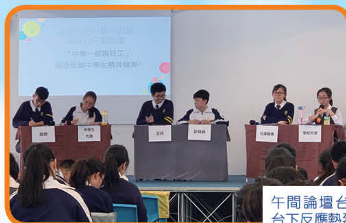
午間論壇台上 台下反應熱烈