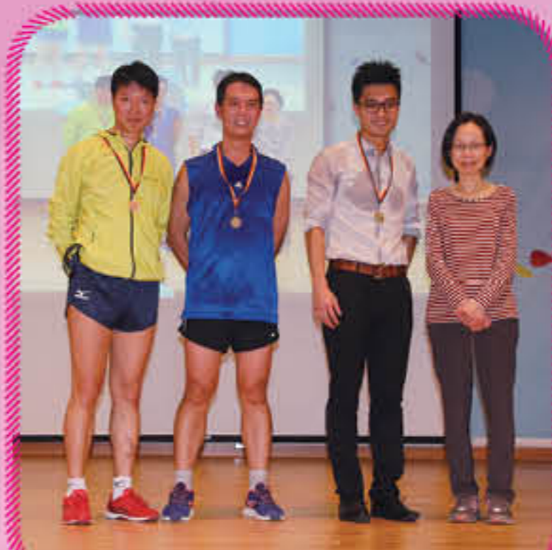
新春長跑男子公開組頒獎禮