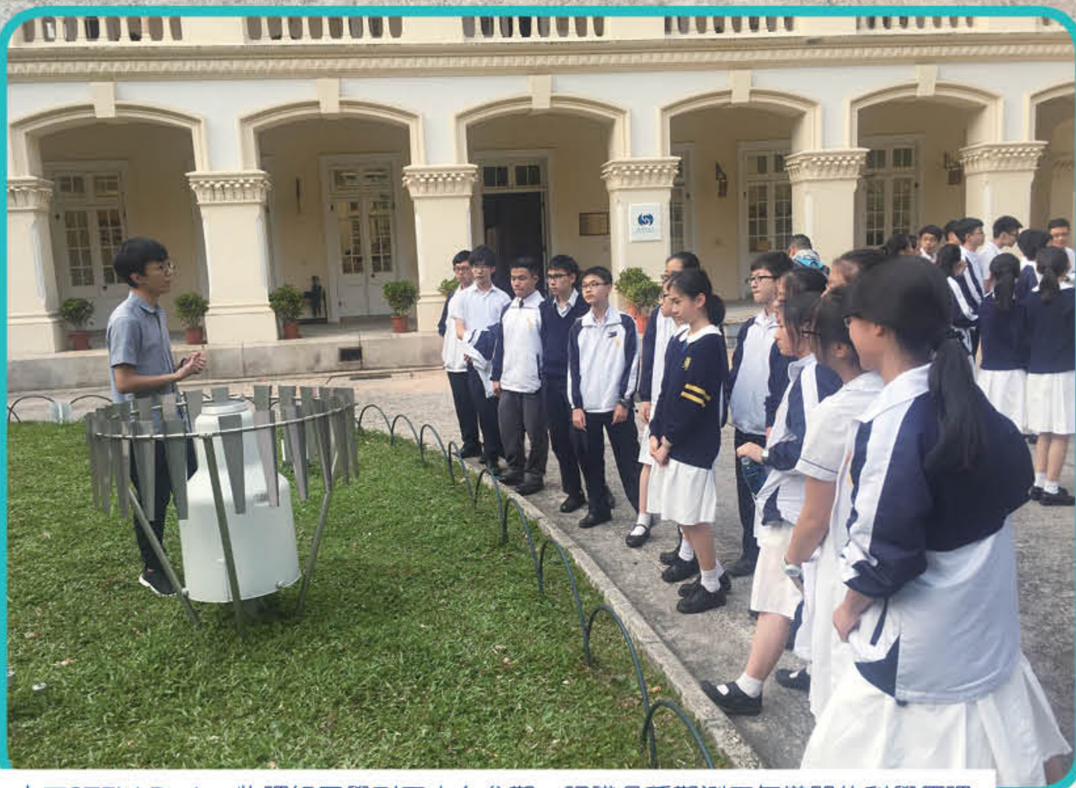
中三STEM Project物理組同學到天文台參觀，認識各種觀測天氣儀器的科學原理