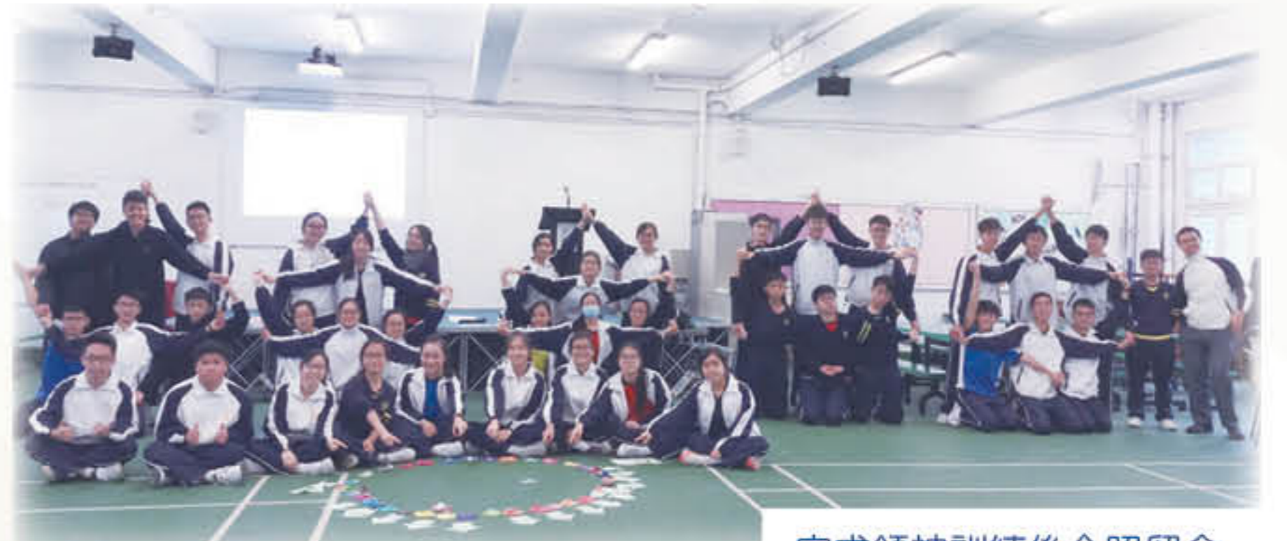
完成領袖訓練後合照留念

我校一直致力為有領導才能的同學提供全面及有系統的領袖訓練，讓他們發揮所長，豐富個人知識和經驗，日後肩負起領導角色，服務學校，負獻社會。於本年二月，學校與青協合辦領袖訓練工作坊予同學，透過不同活動，提升其領導技巧及溝通能力。