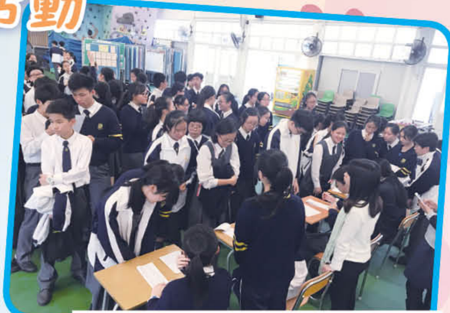
同學踴躍參與「有空說一說，社分加很多」活動

3月5日為本年度普通話日，於班主任時間「普通話比一比」的遊戲中，各班同學投入參與。周會時段，A2創作社應邀到校表演《樂在普通話之火鳳三國群英傳》，劇社演員更邀請同學上台回答普通話問題，增添了話劇互動性和趣味性。午膳時段，各級同學踴躍參與「有空說一說，社分加很多」活動，在鍛煉普通話口語能力之餘，更努力為社爭光，氣氛熱鬧。