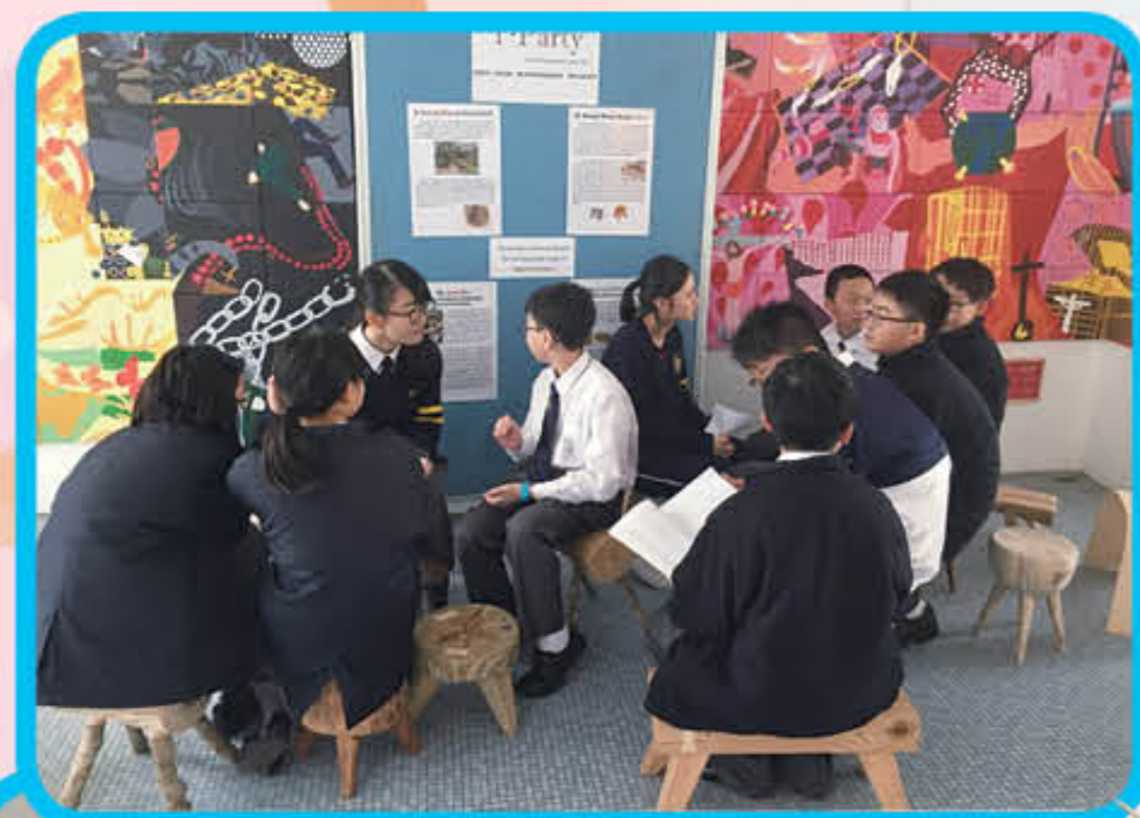
Let's have a T · Party! The stools and chairs are made from abandoned wood