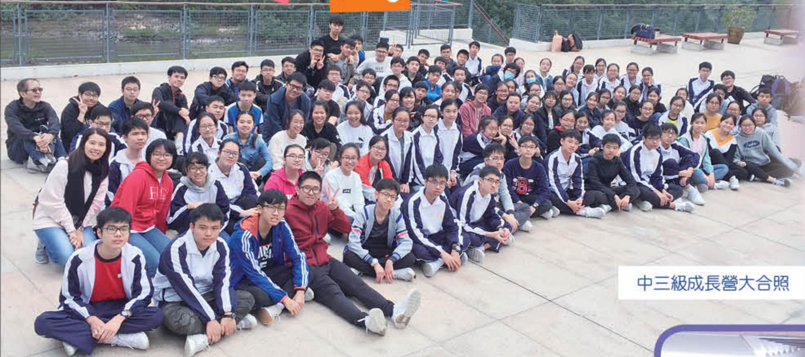
中三級成長營大合照

成長是充滿挑戰的。對於中三同學來說，要應付初中學年最多學科固然是挑戰，面對高中選科更是必要跨過的關口。前進，需要同行者，「中三成長營」為中三同學裝備未來，別具意義。