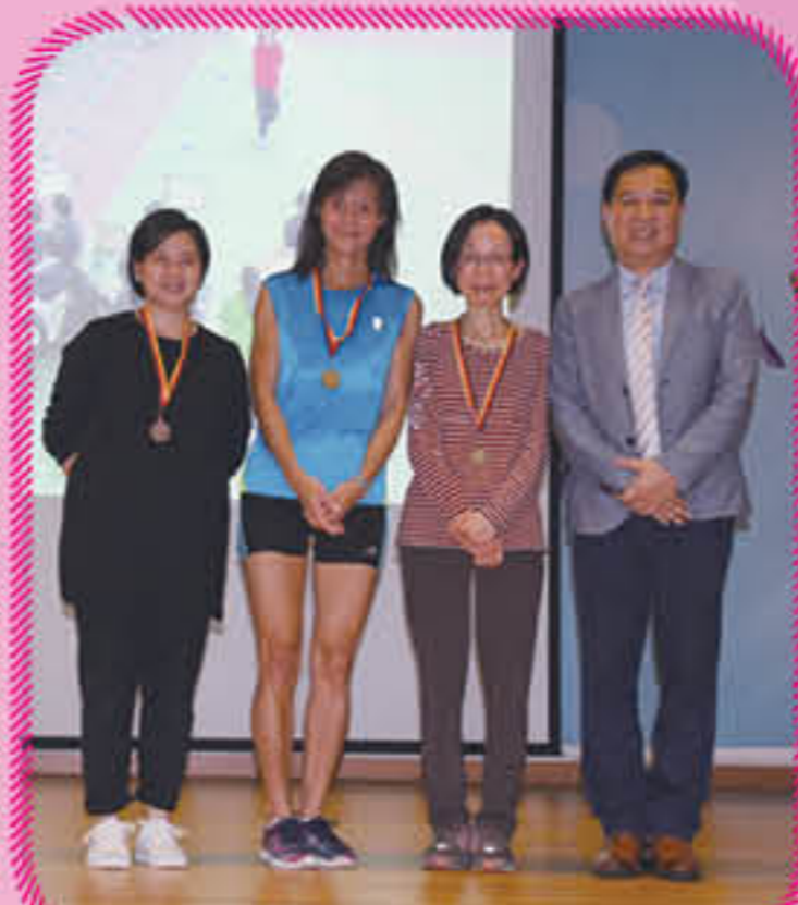
新春長跑女子公開組頒獎禮