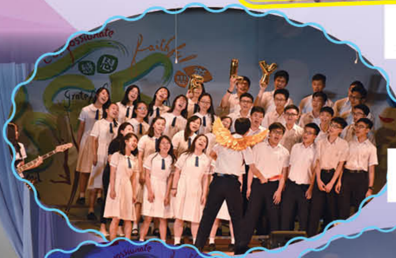
5D班奪高級組合唱冠軍