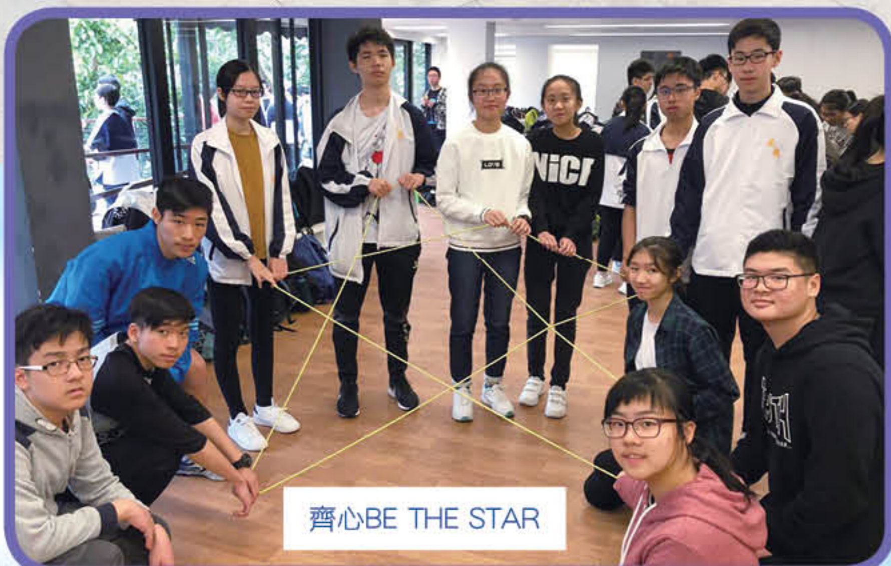
齊心 BE THE STAR

成長營以歷奇活動作結。每組由不同班別的同学組成，在兩個小時內完成自訂的計劃，包括「齊心 Be the star」、「快快手 get the ball」、「合作無間 Double Score」等，沒有一個任務不是要合作的，同學由陌生至認識，由認識至合作，最後完成任務。透過這個營會，希望中三同學滿載而歸，迎接未來。