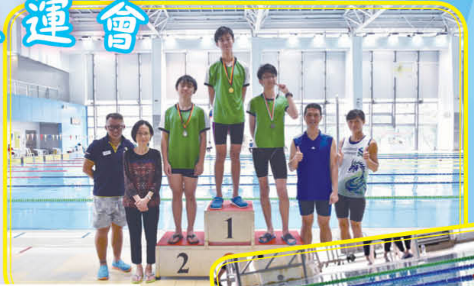
在頒獎台上接受獎牌