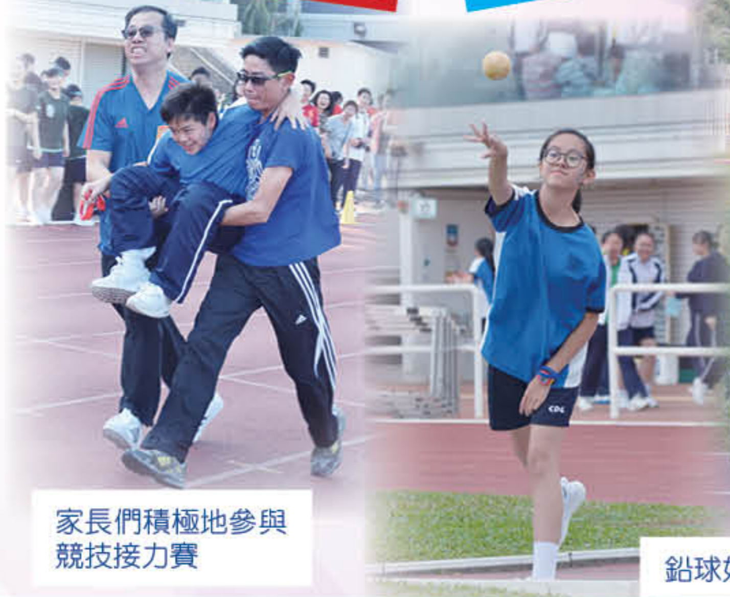
家長們積極地參與競技接力賽