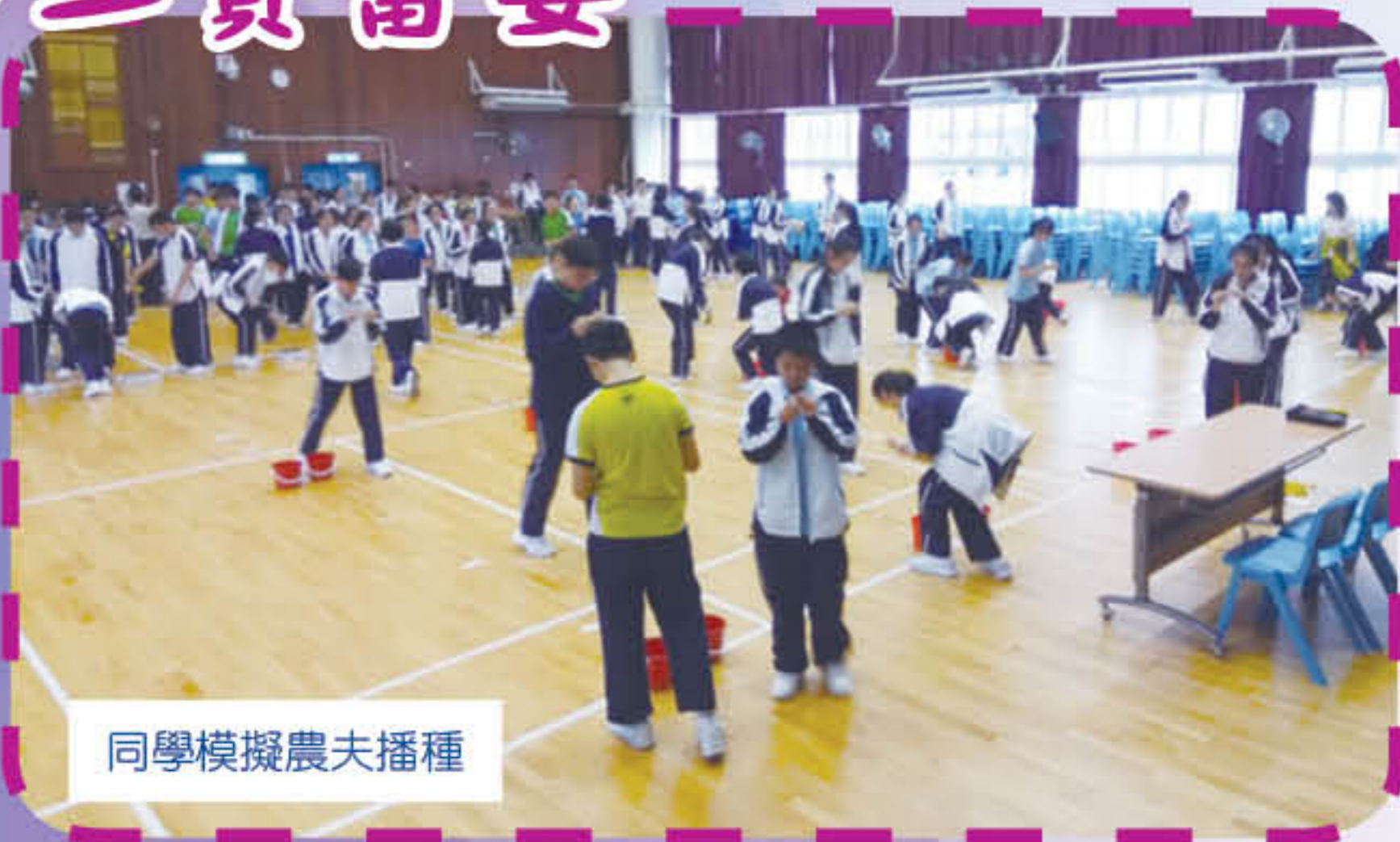
同學模擬農夫播種