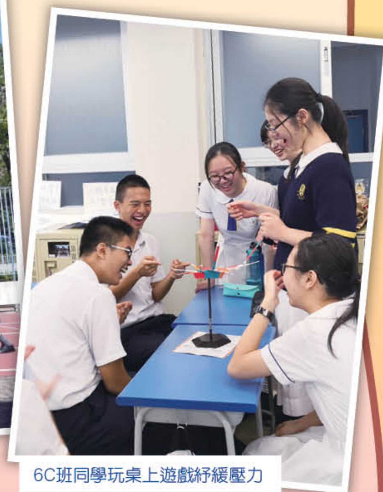
6C班同學玩桌上遊戲紓緩壓力