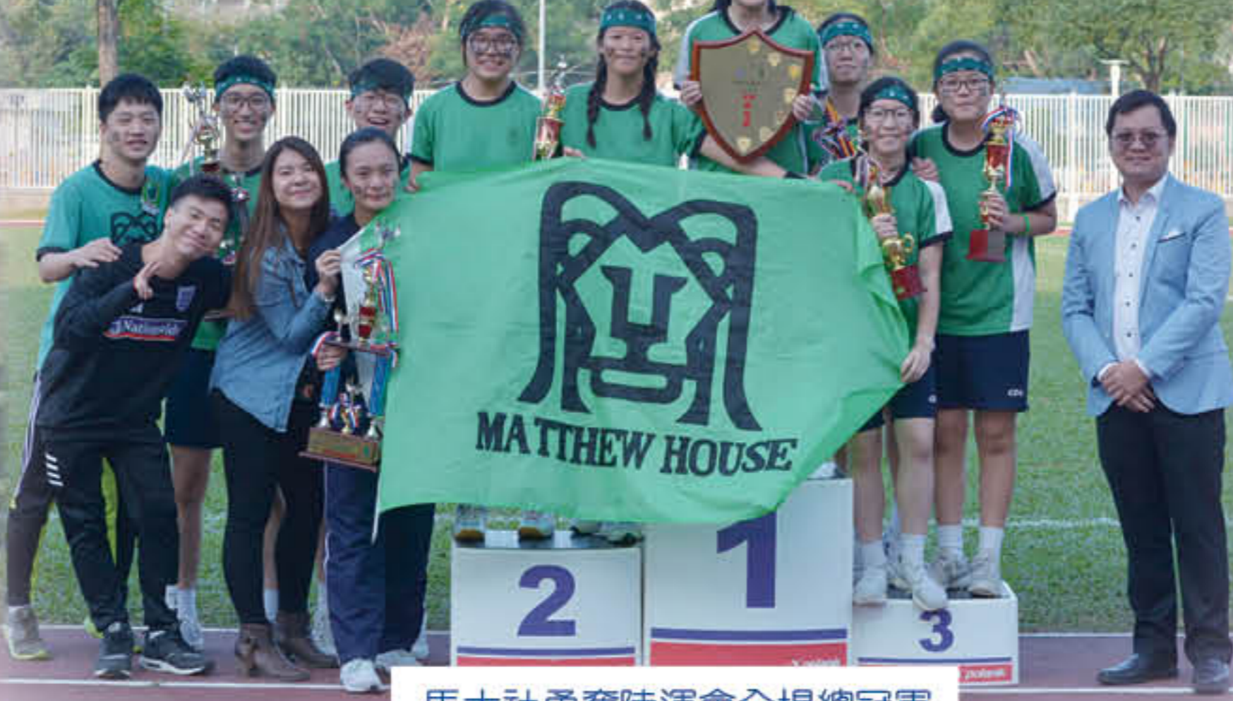
馬太社勇奪陸運會全場總冠軍