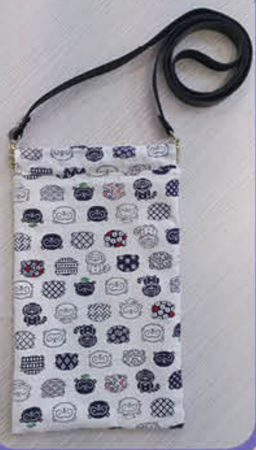
Bag Lau Sum Yuet (3A)