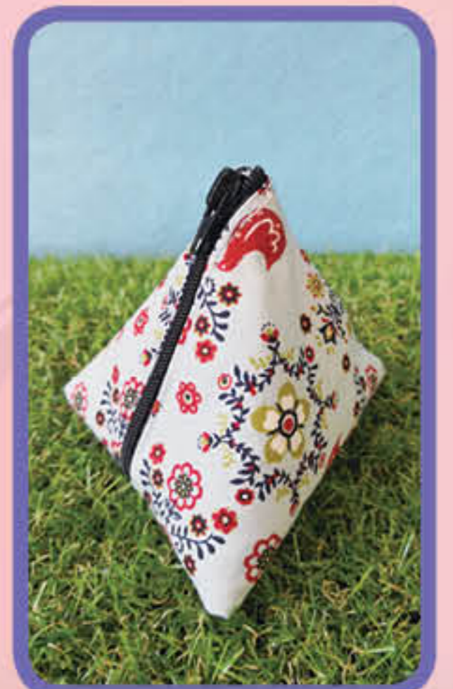
Triangle Zipper Bag Kelly Ang (3D)