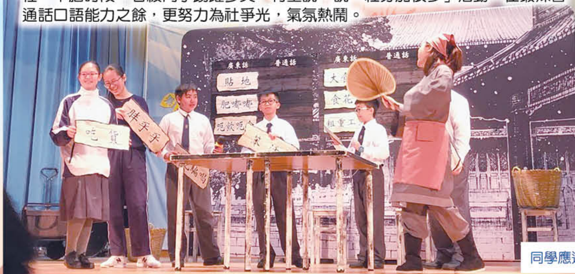
同學應邀參與話劇的互動環節，樂在其中