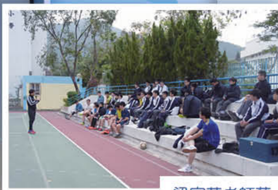
梁家華老師藉足球分享見證