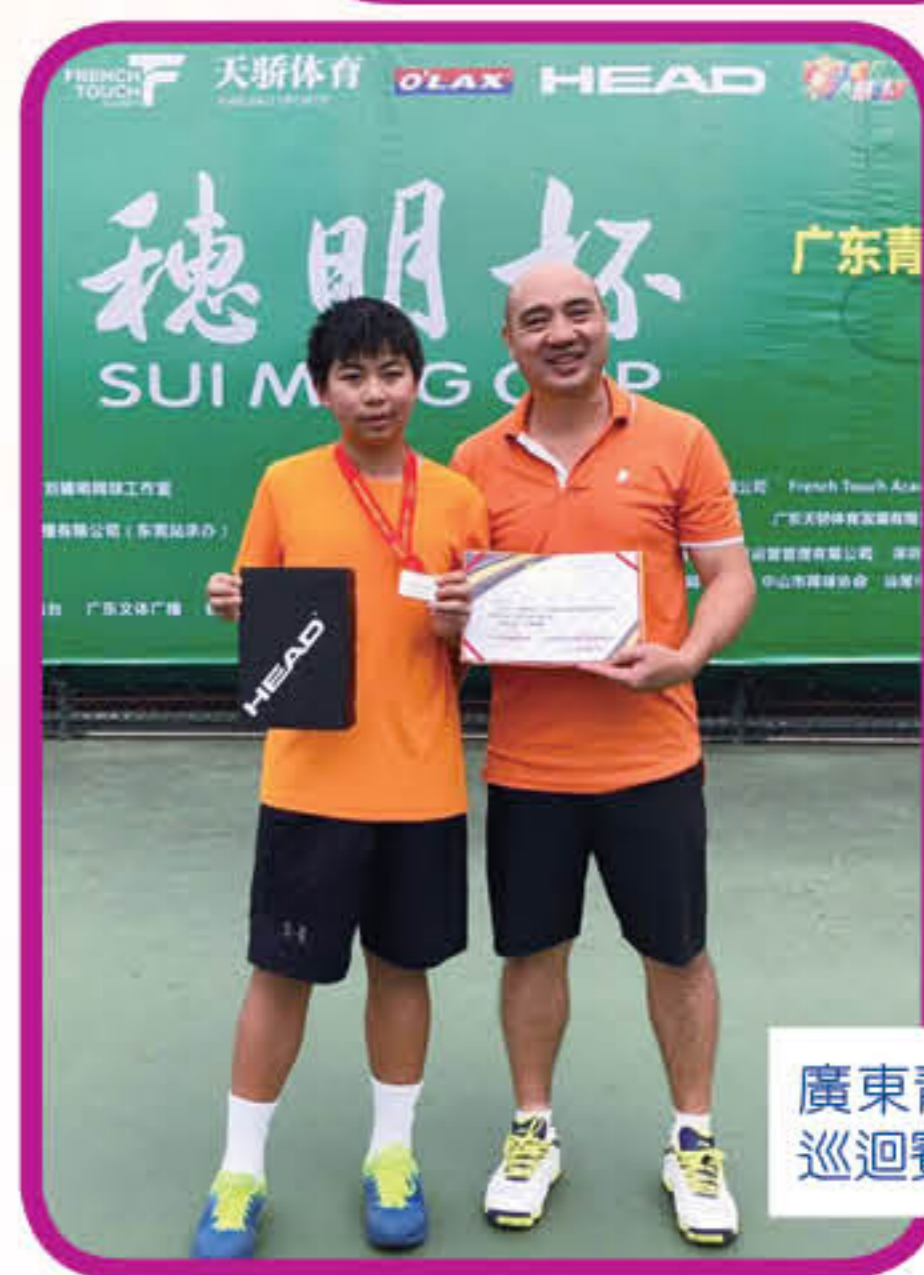
廣東青少年巡迴賽