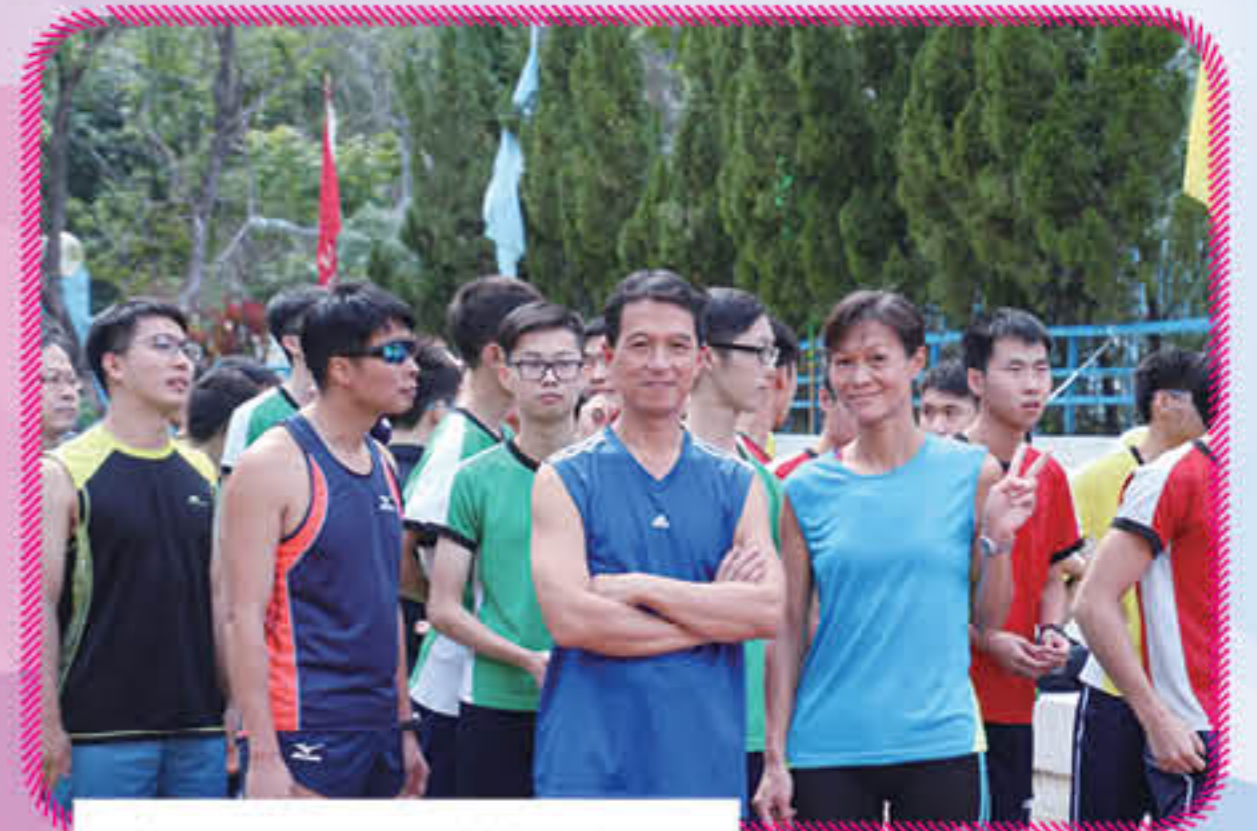
家長及同學們準備出發