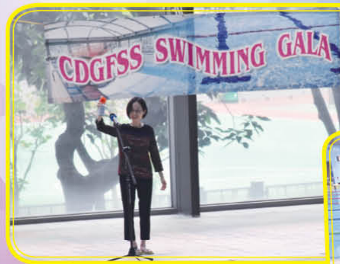
校長鳴槍，為水運會揭開序幕