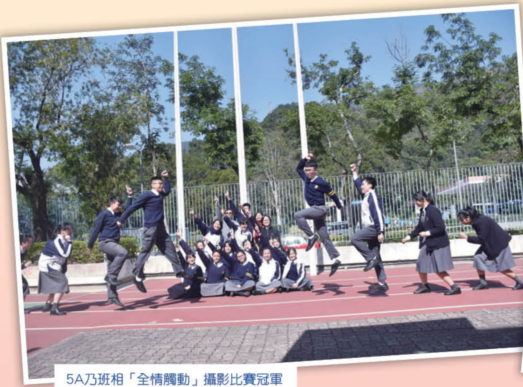
5A乃班相「全情觸動」攝影比賽冠軍