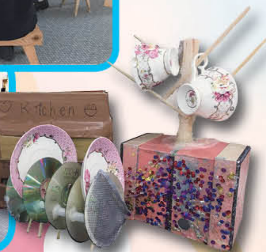
Trash made alive! Let's celebrate the fruits of our creative endeavours

Theme of this School Year: Persevere with Wisdom; Walk in Righteousness