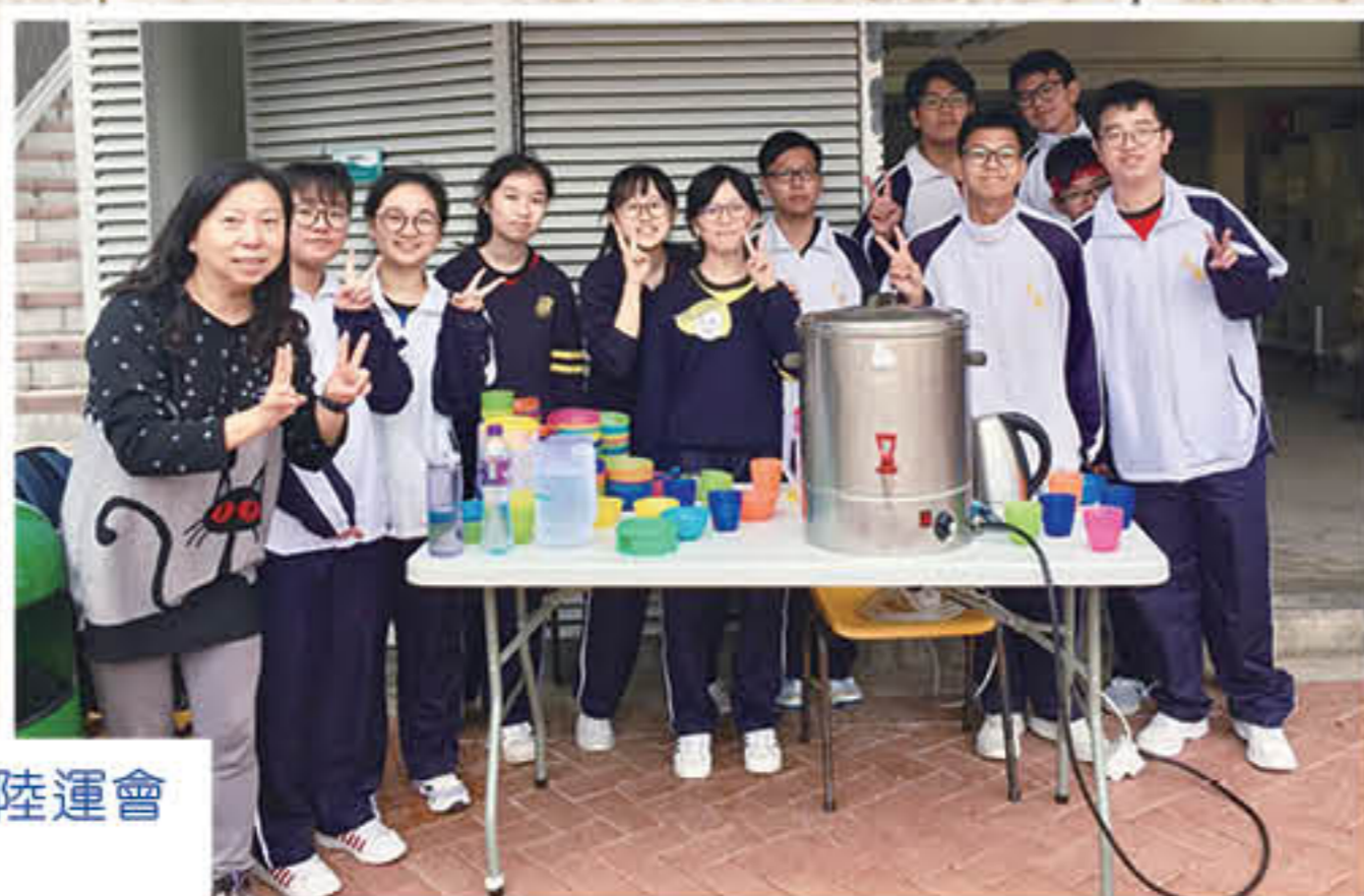
學生會於陸運會提供飲料

感謝同學和老師給予的支持和信任，我們將不忘初心，竭盡所能，給大家帶來精彩的校園生活。