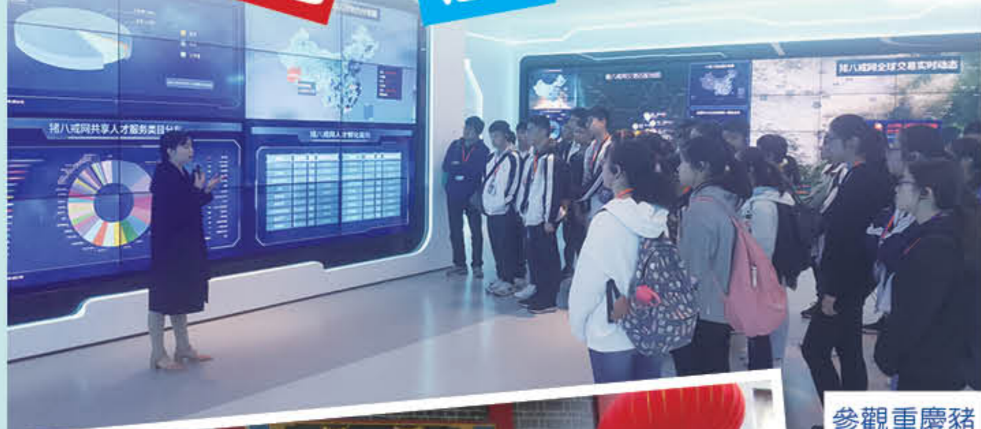
參觀重慶豬八戒網路有限公司