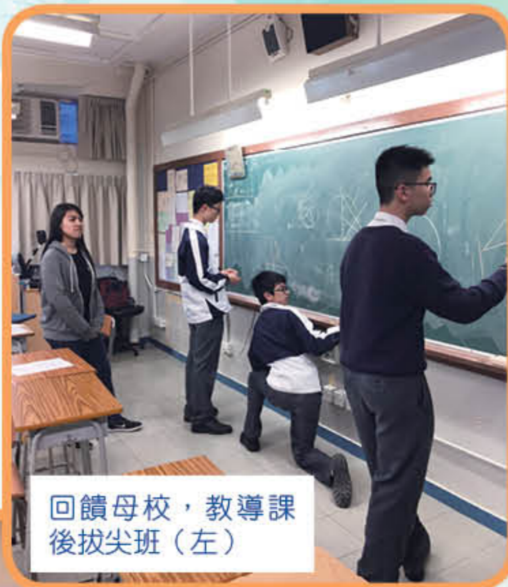
回饋母校，教導課後拔尖班（左）