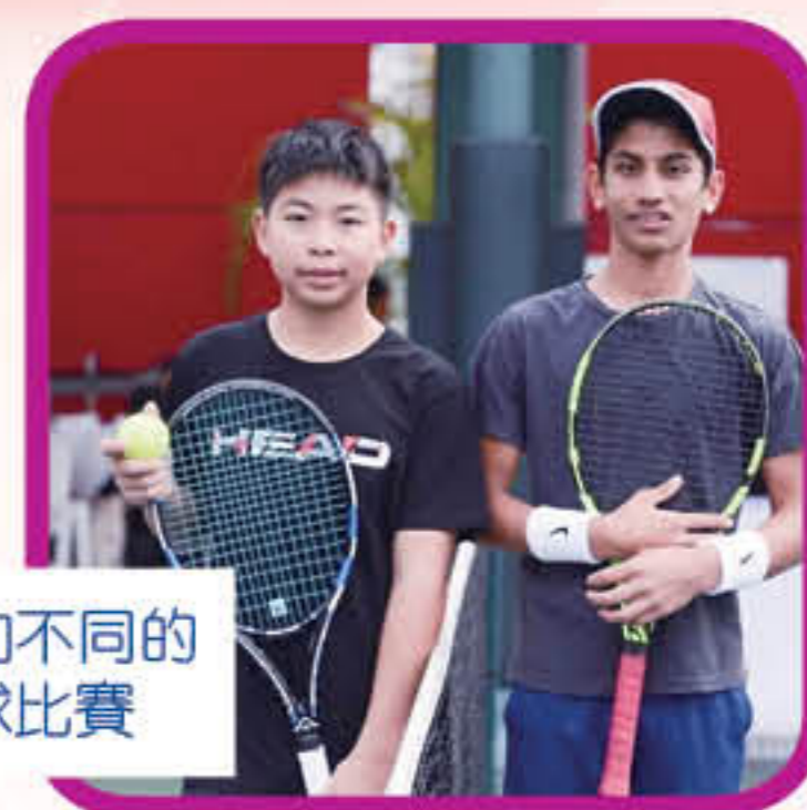
參加不同的網球比賽

對於將來的期盼，周同學笑言：「我希望在努力練習網球後能取得更大的突破。」簡單的一句話，流露了他對自己的要求，有要求才会有進步。