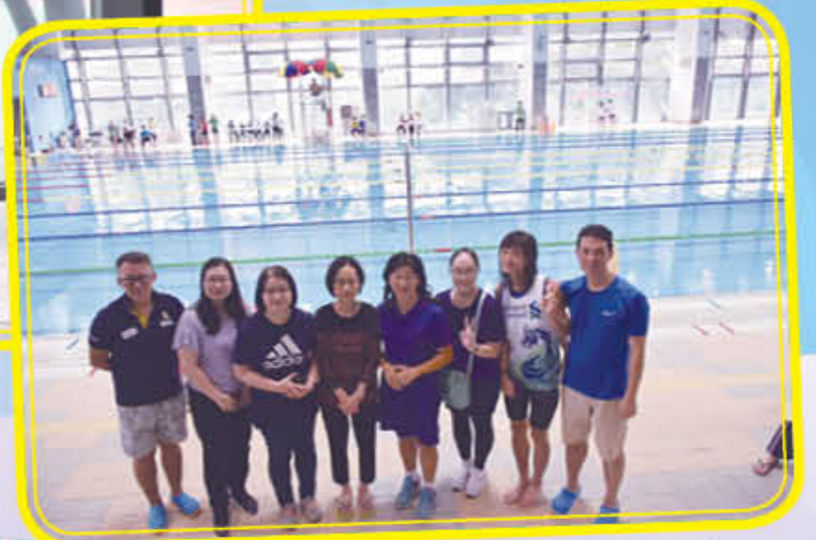
家長全力支持，到場打氣