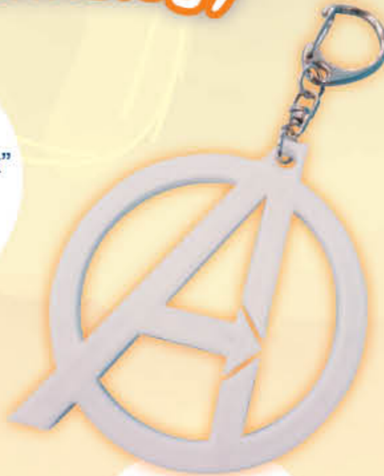
3D Printing Project "Key label" Chan Nok Yin (1A)