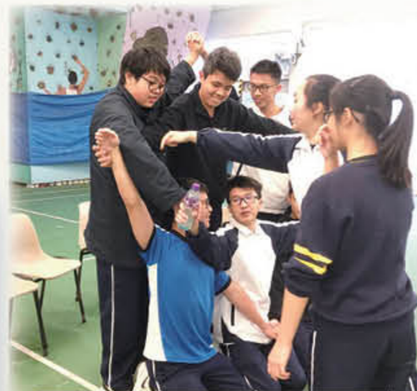
同學合作砌出「領袖之星」