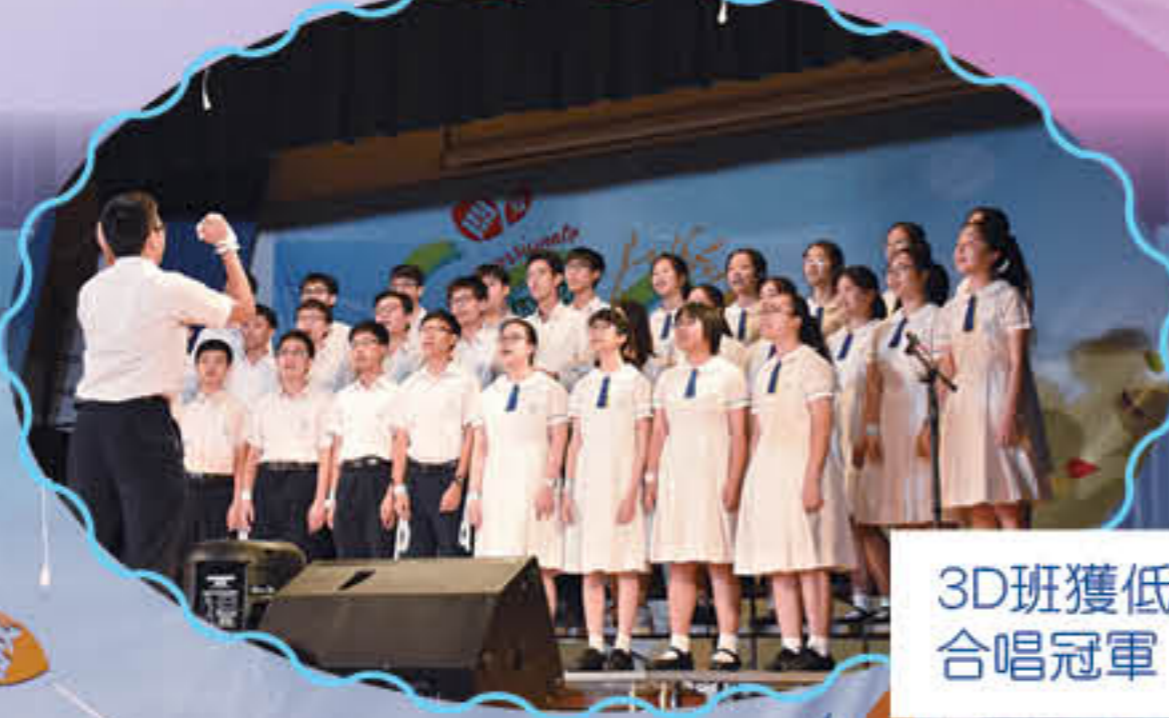
3D班獲低級組合唱冠軍