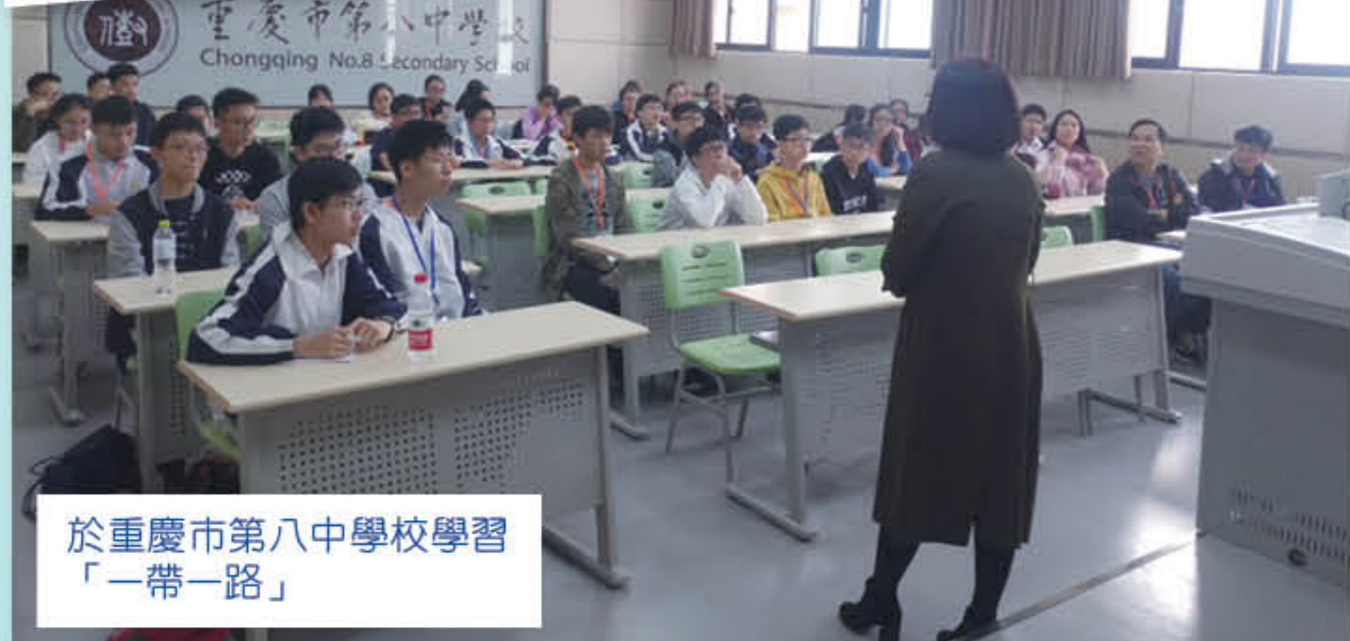
於重慶市第八中學校學習「一帶一路」